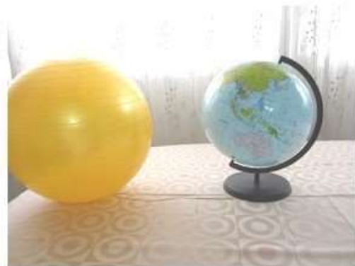
זוית הארץ והשמש בחורף

להראות איש קטן, וכיצד הוא רואה את השמש. לכן אנחנו רואים את השמש באלכסון שונה בקיץ ובחורף. ולא צריך לומר שהכוכבים זזים כל הזמן. תמונות משבילי דירחא שם עמ' 59, ארבע תמונות ביחד על כל המסך.]