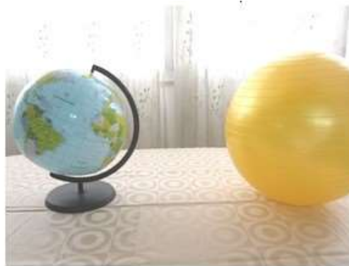
זוית הארץ והשמש בקיץ