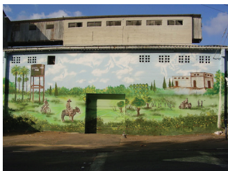
צילום קיר במרכז כפר ויתקין

כפר ויתקין נמצא בעמק חפר, והוא מושב העובדים הגדול בארץ. הוא הוקם בשנת 1930 ונקרא על שם איש החינוך יוסף ויתקין. המתיישבים הראשונים היו 20 חברים מקבוצות ויתקין וג' העמק, והם התמודדו עם ביצות, קדחת והתנגדות של השכנים הבדואים. בשנים הבאות הצטרפו תושבים נוספים למושב, והוא הלך וגדל. המזח שהוקם ליד היישוב שימש בעיקר לקליטת מעפילים והברחת נשק ללוחמי המחתרות, ושם עגנה האונייה אלטלנה שהביאה מטען נשק עבור האצ"ל במהלך מלחמת העצמאות. כיום גרים במושב קרוב ל-2000 תושבים, שכמחציתם עוסקים בחקלאות.