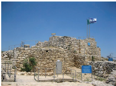
מצודת הקסטל

הקסטל הוא שמה של גבעה הנמצאת על הדרך ממערב לירושלים, בשטח מבשרת ציון. היא נקראת כך על שם המצודה (קאסטלום) שבנו הרומאים במקום. המקום נחשב לנקודה אסטרטגית במהלך קרבות מלחמת העצמאות, בשל שליטתו על הדרך לירושלים. קרבות קשים התחוללו במקום, והקסטל עברה שלוש פעמים מיד ליד, עד שנכבשה לבסוף בידי כוחות הפלמ"ח ונשארה בידי ישראל. כיום זהו אתר לאומי ובו יד זיכרון לחללי הקרב על הקסטל ולמשוריינים שניסו לפרוץ את הדרך לירושלים.