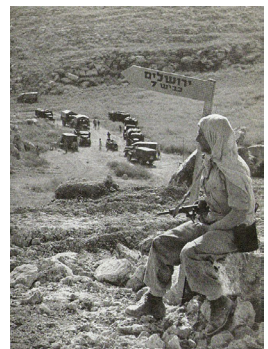
שיירה בדרך בורמה בשנת 1948

במהלך מלחמת העצמאות עמדה ירושלים במרכזם של קרבות רבים. הערבים השתלטו על הדרכים המרכזיות המובילות לחלקה היהודי של העיר, ומנעו מעבר של שיירות לוחמים, מזון ואספקה. ניסיונות רבים נעשו כדי לפרוץ את המצור באמצעות שיירות משורינים ולהשתלט על הדרכים, והכוחות היהודיים ספגו אבידות קשות במהלך קרבות אלה. מבצע נחשון ומבצע הראל היו שניים מהמבצעים שבמהלכם הצליחו להעביר שיירות לירושלים. מאוחר יותר נסללה דרך גישה שכונתה "דרך בורמה", שהצליחה לפרוץ את המצור הירדני על ירושלים הערבית, ובמבצע שילוח הותקן צינור מים שהעביר מים לעיר מאזור חולדה. בזכות מאמצים אלה הצליחו תושבי ירושלים להחזיק מעמד במלחמה.