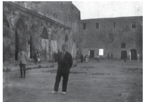
זאב ז'בוטינסקי בחצר כלא עכו, 1920

כלא עכו היה מצודה עות'מאנית ששימשה את הבריטים כבית כלא וגרדום. הפריצה לכלא עכו הייתה פעולה שביצע האצ"ל במטרה לשחרר מהכלא את אסירי המחתרות שהיו כלואים בו. יחידת הנדסה של האצ"ל הטמינה חומרי נפץ שזעזעו את חומות הכלא, ובעקבותיו תקפו את הכלא 34 לוחמים בפיקודו של דב כהן. כוחות נוספים היו פרושים באזור כדי לסייע לאסירים להימלט ולמנוע מהבריטים גישה לאזור. במהלך הפעולה נהרגו דב כהן, שני לוחמים נוספים ושישה מהאסירים הנמלטים. חמישה אנשי אצ"ל נוספים נעצרו. 40 אסירים יהודים הצליחו להימלט. פעולה זו פגעה קשות ביוקרתם של הבריטים וחיזקה את המורל של היישוב היהודי.