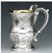
שו"ת שלמת חיים סימן קנט

ותמה הב"ח שהרי כל הברכות במצות דרבנן אינן אלא מדרבנן. אלא מבאר ה"ח, ונראה שהטעם שבעלמא כל מצוה דרבנן תקנהו רבנן בשביל שהמצוה בעצמה יש בה טעם, וראוי לברך וציונו, אבל מצות נטילה לחולין שאין בה טעם בעצמה, אלא תיקנו שיהא רגיל בנטילה זו אף בחולין, כדי שלא יבוא ליגע בתרומה בלא נטילה, קשיא ודאי מאי וציונו, כיון שאין טעם במצוה עצמה אלא משום סרך תרומה, ותרין שגם ברכה זו אסמכוהו אלאו דלא תסור.