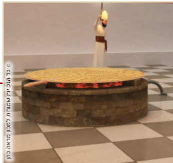
ח. קליה באבוב