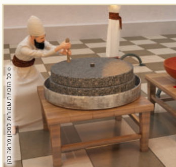
יב. טחינה שניה