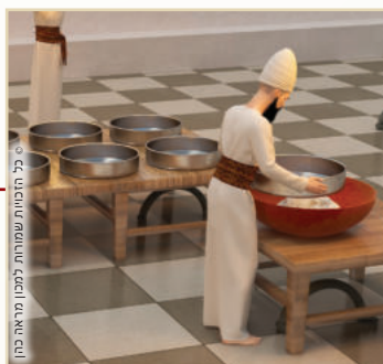
יא. ניפוי בי"ג נפה