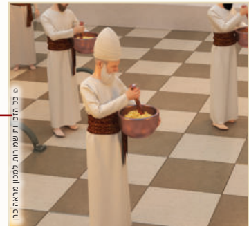
ז. כתישה במכתשת