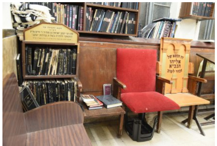
מקומו הצדדי של קהילות יעקב שהפך לארון ספרים (נראים גם ספסל העץ של הגר"ח גריינימן, וכסא הסנדקאות של הגר"ח קנייבסקי)

מנהג זה הותיר רושם לדורות: מיד אחרי פטירתו קבעו את מקומו הקדוש לארון ספרי 'קהילות יעקב', ארון זה משמש גם כזיכרון לענוותנותו של רבינו.