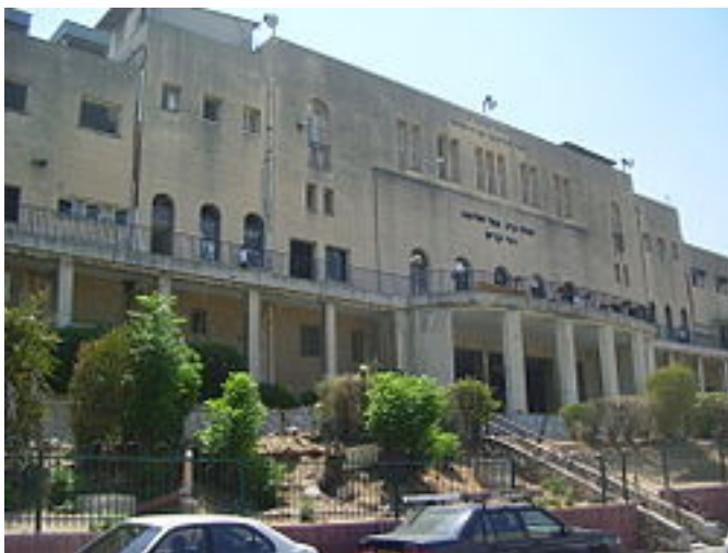
המרפסת המפורסמת של פוניבז' (מעליה הבטחת החפץ חיים מלשה"כ: ובהר ציון תהיה פליטה והיה קודש)

מפורסמת היא ה"מרפסת של פוניבז'" שם יוצאים הלומדים המעמיקים לנשוף אוויר תוך כדי עיונם. קבוצות קבוצות של בחורים דנים ומתפלפלים בעומקה של סוגיה. בחורים שקועים בשרעפים צועדים בה הלוך ושוב כשמוחם חרוש קמטי מחשבה וידיהם שלובות מאחורי גבם... כך בכל ישיבה וישיבה, מימות הגמרא ועד ימינו, יש את ה"אכסדרה דבי רב" שלה, המספקת משב אוויר וקרני שמש לעמלי התורה.