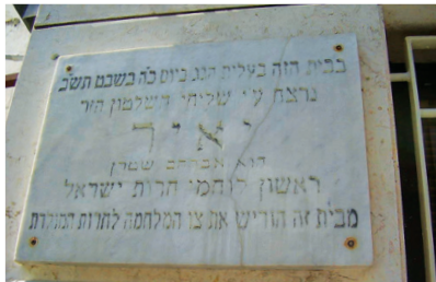
שלט הנצחה בכניסה למוזיאון