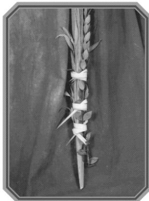
מוזר לאגוד את ההדסים והערבות באופן שמסובב עלה לולב מסביב לני מינים ותחוב את ראש העלה בעלה המסתובב

שיאגדם עם גומיה, או שיקח עלי לולב ויכול אפי' לתולשם ביו"ט, דאין מלאכת קוצר בדבר שכבר נקצר, ויקשור את ההדסים והערבות בשני קשרי עניבה אחד על השני או שיעשה קשר אחד מתחת לקשר העניבה ויזכור במוצאי יו"ט להתיר את האגידה, כדי שלא יעבור על קשר עניבה כ"ד שעות, או שיעשה טבעות מעלי הלולב, ויראה לפרק את הטבעות תוך כ"ד שעות, או שיתלוש עלי לולב ויסובב מסביב הלולב והמינים ויתחוב את ראש העלה בעלה המסתובב