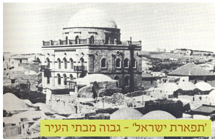
'תפארת ישראל' - גבוה מבתי העיר