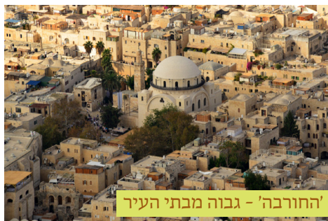
'החורבה' - גבוה מבתי העיר