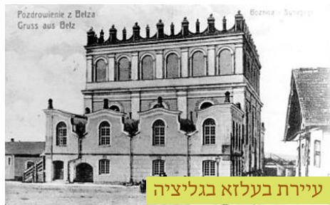
עיריית בעלזא בגליציה

שני דינים: חקר הגר"נ קרליץ זצ"ל (זכרון משה עמוד טז, חוט שני הלכות בית כנסת עמוד רמה) האם העיקר שבית הכנסת יהיה יותר מכוונד כשהוא גבוה מהבתים