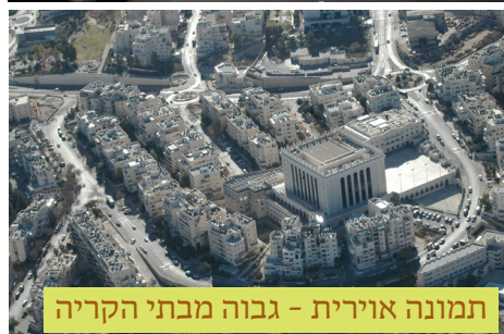
תמונה אורית - גבוה מבתי הקריה

בית הכנסת בעירייה בעלזא שנבנה על ידי כ"ק האדמו"ר השר שלום מבעלזא זיע"א מבתי הכנסת המפורסמים באירופה, היה גבוה משאר בתי העיר ונצפה גם מרחוק. בית הכנסת המרכזי של חסידות בעלזא בקריית בעלזא ירושלים שנבנה על ידי כ"ק האדמו"ר מבעלזא שליט"א, הוא מבתי הכנסת הגדולים בעולם.