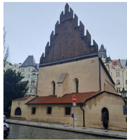
'אלטנוי שול' במרכז הרובע היהודי בפראג וגבוה מבתי העיר שסביבו

ובהמשך לכך יתבאר בגיליון הבא (מספר 505) מה הטעם שנהגו כיום להקל ולבנות מעל גובה בית הכנסת?