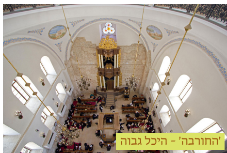
'החורבה' - היכל גבוה

מבנה בית הכנסת החורבה בעיר העתיקה בירושלים ומבנה בית הכנסת תפארת ישראל בעיר העתיקה בירושלים המכונה ניסן ב"ק שול נבנו באופן שיהיו גבוהים מבתי העיר, כאשר חלל בתי הכנסת גבוהים יותר מכל חלל בתי מגורים, וגם מבני בתי הכנסת מפוארים ומרשימים ביותר.