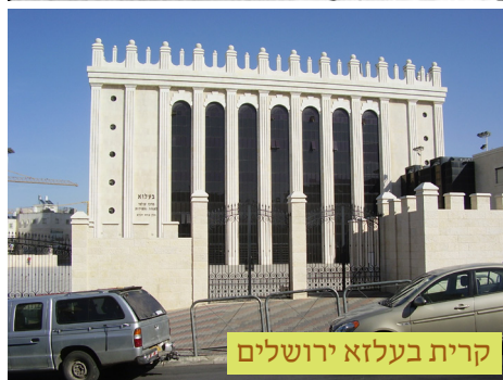
קרית בעלזא ירושלים