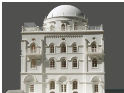
'תפארת ישראל המשוחזר' - נאה ומפואר