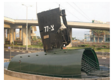
חלק מסיפון הצוללת סמוך למוזיאון חיל הים בחיפה (Wikipedia) https://www.fresh.co.il/vBulletin/showthread.php?t=358973

על אף חיפושים נרחבים שנערכו אחריה על ידי אוניות, צוללות וכלי טיס, לא נמצאה הצוללת על פני המים והיא הוכרזה כאבודה. ב-28 במאי 1999, 31 שנים וארבעה חודשים לאחר היעלמה, נמצאו שרידיה של "דקר" על ידי אוניית החיפוש של חברת נאוטיקוס. השרידים נמצאו בעומק 3 ק"מ על הנתב לחיפה, במרחק 485 ק"מ מיעדה. המידע וההערכות על הסיבות לאובדנה לא פורסמו, ובדעת הקהל בישראל נוצרה תעלומה וטראומה לאומית.