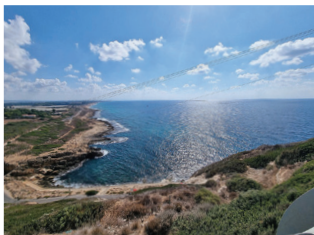
הגדה המזרחית של הים התיכון מראש הנקרה

הים התיכון נמצא בין אפריקה, אסיה ואירופה, ומתחבר במערב אל האוקיינוס האטלנטי. הוא נקרא כך משום שהוא נמצא בתווך, במרכז. הים התיכון מהווה את גבולה המערבי של ארץ ישראל, ונקרא בתורה "הים הגדול" או "הים האחרון" (כלומר המערבי, האחורי, בניגוד למזרח שנקרא "קדם"). לאורך ההיסטוריה הוא שימש כנתיב מרכזי לתנועה ומסחר בין התרבויות השונות שלחופיו, וגם היום עוברות בו ספינות רבות. חיל הים הישראלי אחראי להגן על ישראל מפני איומים מכיוון הים. הצוללת דקר נעלמה במהלך הפלגתה בים התיכון, בדרכה לחיפה.