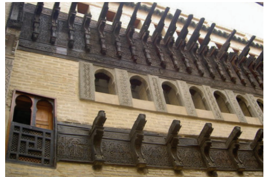
ביתו של הרמב"ם בפאס, מרוקו

יהודים עלו ממרוקו לארץ ישראל לאורך כל הדורות. עם הקמת המדינה ופרוץ מלחמת העצמאות החריף היחס העוין כלפי היהודים במרוקו, והחל גל עלייה גדול לארץ. בשנים 1948-1956 הייתה מרוקו תחת שלטון צרפתי, שאיפשר ליהודים לעלות לארץ תחת מגבלות. בשנים אלה עלו 85,000 יהודים. בחמש השנים הבאות נאסרה ההגירה, אך 30,000 יהודים הצליחו לעלות לארץ באופן לא חוקי בספינות מעפילים. בשנים 1961-1967 עלו לארץ 120,000 יהודים במסגרת מבצע יכין, בהסכמה בשתיקה מצד השלטונות. סך הכל עד שנת 2000 עלו ממרוקו לארץ קרוב לרבע מיליון יהודים, ורק אלפים בודדים נותרו שם.