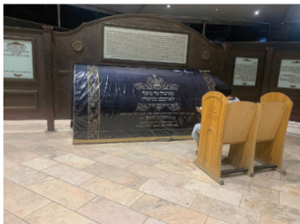
קבר הרמב"ם בטבריה

קבר הרמב"ם נמצא בטבריה. הרמב"ם נפטר במצרים, אולם מסופר שהוא הורה שלא לקבור אותו שם אלא להעלות את ארונו לארץ ישראל, וכך הובא לטבריה ונקבר בה. בסמוך אליו נמצאים גם קבריהם של תנאים, אמוראים וצדיקים אחרים, ביניהם השל"ה הקדוש. בשביל המוביל לקבר הוקמו 14 עמודים שעליהם שמות חלקי ספרו של הרמב"ם, "משנה תורה".