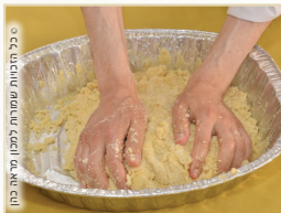
בכל המנחות [במנחת סולת - מחלוקת]