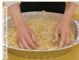
בכל המנחות מלבד מנחת ריקקין