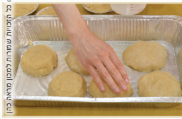
בכל המנחות מלבד מנחת סולת