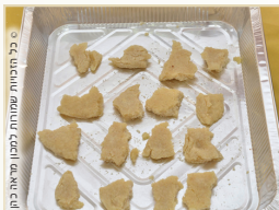
בכל המנחות מלבד מנחת סולת