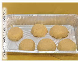
בכל המנחות מלבד מנחת סולת