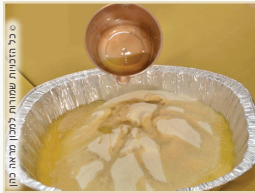
בכל המנחות מלבד מנחת ריקקין