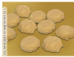
בכל המנחות מלבד מנחת סולת