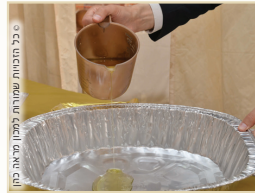
במנחות מאפה תנור - מחלוקת