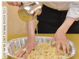
בכל המנחות [במנחת סולת - מחלוקת]