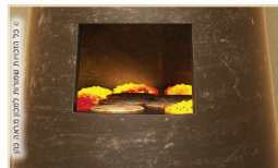
במאפה תנור (חלות וריקקין) - אפיה במחבת ומרחשת - טיגון במנחת סולת - אין