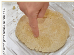
במנחת ריקקין בלבד