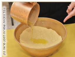
בכל המנחות מלבד מנחות מאפה תנור (חלות וריקקין)