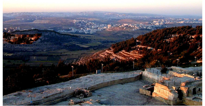
מנוב לגבעון. מבט מ'נבי סמואל' בצפון ירושלים (בימין התמונה), המזוהה, לפי אחת ההשערות, עם נוב המקראית, לכיוון גבעון (הגבעה משמאל). על פי דעה המופיעה בתוספתא, אכילת הקדשים בימי נוב וגבעון היתה ב"כל הרואה", כדינה של שילה בשעתה.

מן הגמ' משתמע חילוק מהותי בין הגלגל לבין נוב וגבעון: "בג' מקומות שרתה שכינה על ישראל: בשילה, ונוב וגבעון, ובית עולמים, ובכולן לא שרתה אלא בחלק בנימין" (קיח, ב). "ג' בירות הן: שילה, ונוב וגבעון, ובית עולמים" (קיט, א). הגלגל לא נמנה כמקום השראת שכינה וכ"בירה". כמו כן בעניין צורת המזבח (לעיל סא, ב): "אבנים ג' פעמים, אחד של שילה, ואחד של נוב וגבעון, ובית עולמים". טעם הדבר, שבזמן הגלגל היה הדבר ברור מלכתחילה שאין זה אלא כהמשך למסעות בני ישראל במדבר, למשך זמן הכיבוש והחלוקה, ובמהרה יקבע המשכן במקום אחר. לעומת זאת בנוב וגבעון אפשר שלא ידעו בבירור על זמניותו (ראה בבלי יקר הנ"ל), ועל כל פנים לא היתה תוכנית ברורה שלאחר פרק זמן מסוים יועבר למקום אחר (עייני מהרש"א קיח, ב).