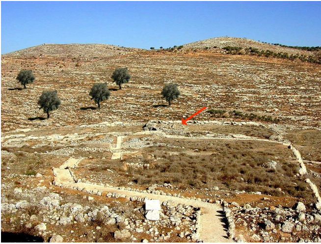
שילה ו"כל הרואה". במרכז התמונה נראים שרידי מקום משכן שילה כיום. ניתן היה לאכול קדשים קלים בכל האזור שממנו ניתן לצפות על שילה.

לדיון על גדר תחום "כל הרואה", האם דינו כמחנה ישראל גם לשאר דברים מלבד אכילת קדשים, ראה לעיל מערכה שב.