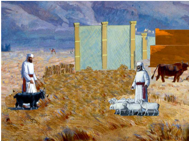
קרבות המוספים בבמת ציבור. הכל מודים שקרבות הציבור שזמנם קבוע הובאו בבמת ציבור, אך לדעת רבי שמעון פר העלם דבר, שאין זמנו קבוע, לא הובא בה. קיימות גרסאות חלוקות בשאלה האם לדעת רבי שמעון שעירי החטאת של המוספין הובאו בבמת ציבור.

כך: לא כל חובות הציבור שקבוע להם זמן קרבות בבמה גדולה, אלא רק עולות, מפני שהן באות גם בנדבה, ויש כמותן בבמה קטנה. אולם חטאות הציבור שקבוע להן זמן (שעירי המועדים) אינן קרבות בבמה גדולה 16 . הגמ' מציעה להעמיד את הברייתא במנחת חביתין, הנחשבת כקרבת ציבור 17 (להיפך ממה שיוצא על פי הנוסח הקודם), ודוחה, שרב אדא סובר שאין מנחה בבמה, ולפיכך לא קרבו חביתין אפילו בבמת ציבור (חמדת דניאל; חזון איש קמא סי' מא, טז).