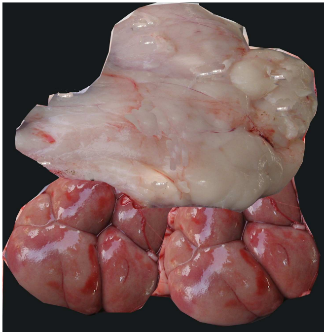
חלבין על גבי הבשר. בהנחת בהמה כדרכה החלבים נמצאים מעל הבשר, ונמצא שהבשר חוצץ בין האימורים למזבח. לפיכך שמואל מעמיד את המשנה, המחייבת על העלאת בשר ואימורים יחדו, במקרה שהפכן, כך שהחלבים למטה.

שיש חיוב העלאה בחוץ גם על גבי סלע או אבן. על פי דרכו של רש"י לעיל כוונת התירוץ, שכשם שר"ש אינו מצריך העלאה על גבי מזבח – כך אינו מצריך הקטרה הדומה להקטרת פנים; ועל פי דרכו של המיוחס לר"ח הפירוש הוא שאין צורך בהעלאה על מזבח דווקא (לדיון בפירושיהם בשיטת ר"ש ור' יוסי עיין לעיל מערכה רפו). ג. רב עונה