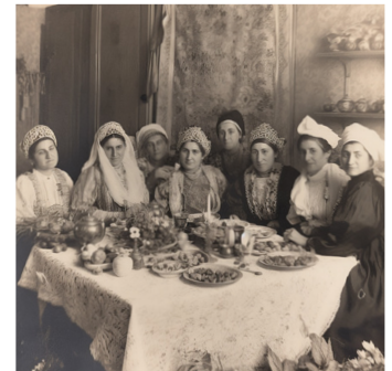
חג הבנות באלג'יר

חג הבנות או ראש חודש לבנות הוא חג שנחגג על ידי חלק מהקהילות היהודיות בצפון אפריקה על נס את העוצמה הנשית, הגבורה, החוכמה והאחוה של נשים לאורך הדורות. לפי מסורת אחת, מקור החג בגבורתה וחוכמתה של יהודית, שכבשה ביופייה את הולופרנס שר הצבא, ערפה את ראשו והצילה בזכות מעשיה את אנשי יהודה. מסורת אחרת גורסת שהחג נוצר לזכר גבורתה של האישה שעוררה את אחיה החשמונאים להתחיל את המרד ביוונים. לפי השערה נוספת, מקור החג במסופר במגילת אסתר, לפיה זה היום שבו הובאה אסתר בפני המלך אחשוורוש והומלכה תחת ושתי. החג נשומר בחלק קטן מקהילות ישראל בצפון אפריקה: תוניסיה, ג'רבה, לוב, אלג'יריה ומרוקו. נשים, נערות וקשישות נהגו וחלקן נוהגות עד היום להתאסף לחגיגה שבה הן לומדות, רוקדות, שרות ושולחות מנות אישה לחברתה. יש שנהגו לבקש סליחה אישה מרעותה, כביום הכיפורים; יש שנהגו לקיים ביום זה חגיגה לכל בנות המצווה.