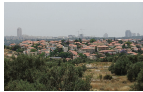
חשמונאים מצפון (מאחור נראים מגדלי מודיעין)

חשמונאים הוא יישוב דתי-לאומי במערב הרי בנימין בדרום השומרון, צפונית לעיר מודיעין, השייך למועצה האזורית מטה בנימין. ממערב ליישוב נמצא הכפר הערבי אל-מידיה, שיש הסבורים שהוא מקומה של מודיעין החשמונאית. היישוב ממוקם על גבעה בגובה 280-220 מטר, במיקום בעל חשיבות אסטרטגית רבה. באזור מקובל לזהות את מודיעין הקדומה. באתר התגלו שרידי מבנים ובורות מים וכן חרסים ומטבעות מהתקופות ההלניסטיות והרומית. בנוסף, התגלתה באתר מערכת מסתור אופיינית ובתוכה נמצאו חמישה מטבעות, שניים מהם מטבעות בר כוכבא. ממצאים אלו מעידים על כך שבתקופה הרומית הקדומה התקיים במקום יישוב יהודי. היישוב הוקם בשנת 1987, יישוב עירוני דתי ובו מגוון אוכלוסייה. ביישוב כ-680 משפחות, כולל זוגות צעירים, דור שני ושלישי ביישוב, שהצטרפו אליו לאחרונה. חלק גדול מתושבי היישוב הם עולים שהגיעו לארץ במהלך העשור האחרון.