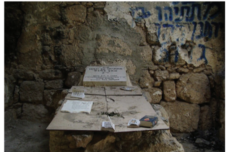
קבר המיוחס למתתיהו הכהן בתוך חורבת הנגדי, ליד קברות המכבים בעיר בן שמן

מתתיהו החשמונאי, שהתגורר בעיר מודיעין היה ראש משפחת כוהנים חשובה, אחת מ-24 משמרות הכוהנים ששירתו בבית המקדש. הוא היה אביהם של יהודה המכבי, שמעון החשמונאי, יונתו החשמונאי, אלעזר ויוחנן. לעת זקנתו של מתתיהו, החלו להיגרר על ידי אנטיוכוס ואנשיו גזרות שמד על היהודים, כדי להעביר אותם על דתם תוך חילול בית המקדש בירושלים. חיילים יוונים הגיעו למודיעין, בנו מזבח והכריחו את היהודים לבחור לאלים. בתגובה לגזרות אלו, מתתיהו השמיד את הבמה, וברח עם בניו אל ההרים. שם מצווה מתתיהו את בניו לשמור את מצוות התורה ומכריז על פתיחת המרד ביוונים, תרבותם וגזרותיהם.