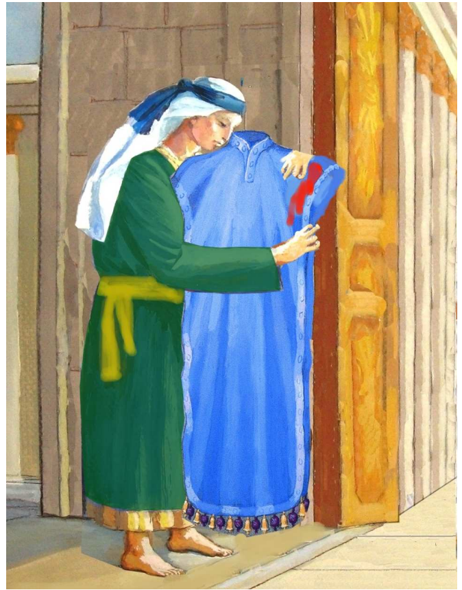
"מעיל שנטמא - מכניסו בפחות משלוש על שלוש ומכבסו". ניתן לעמוד בשער ניקנור, שחללו נחשב כמחוץ לעזרה, ולהכניס מן הבגד מעט מעט, כך שאין בעזרה שיעור שלם של בגד טמא, ובכך נתקיימה מצות הכיבוס באופן שממעט את הטומאה במקדש.

מעיל הכהן הגדול שניתו עליו דם חטאת ואחר כך יצא חוץ לעזרה ונטמא, שאין אפשרות לקורעו, כמו שנאמר בתורה לגבי המעיל (שמות כח,לב): "לא יקרע".