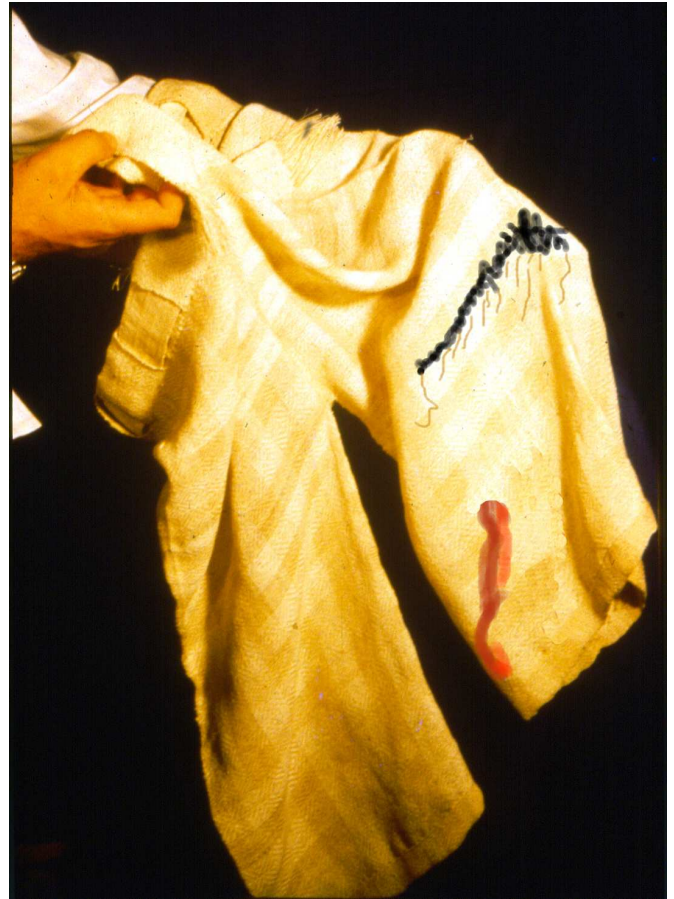
בגד טמא ובו דם חטאת. על מנת לאפשר את כניסתו לעזרה לצורך מצות כיבוסו יש לקרוע את רובו ולשייר "כדי מעפורת", שיעור מספר טפחים. הבגד אמנם טמא עדיין מדרבנן, אבל הותר להכניסו בטומאה זו לצורך מצות הכיבוס. לדעת הראב"ד מקום הדם צריך להיות כולל בחלק שאינו קרוע.

זוהי גרסת הגמ' לפנינו, ובכמה ראשונים (תוס' ד"ה לא שנו; פסקי הרי"ד; רמב"ם הל' מעה"ק ח, כא). בפני רש"י