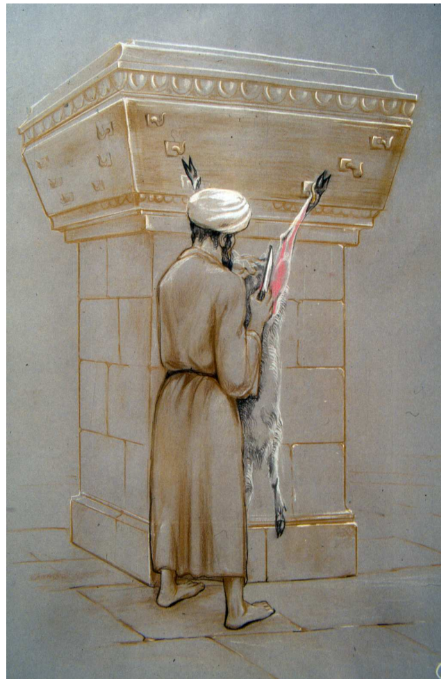
עור שלא הופשט. כאשר העור עדיין מחובר לגוף הבהמה, אפילו באופן חלקי, הכל מודים שאינו מקבל טומאה, ואף אינו נחשב "ראוי לקבל טומאה", ולכן אם ניתז עליו דם חטאת - אינו טעון כיבוס. לדעת רש"י, הסיבה לכך היא שהעור זקוק למעשה כדי להביאו לכלל טומאה.

נאמר בתורה (ויקרא ו,כ) על קרבן החטאת: "ואשר יזה מדמה על הבגד אשר יזה עליה תכבס במקום קדוש". במשנה נאמר, שלא רק בגד העשוי מבד טעון כיבוס, אלא כל דבר רך הראוי לכיבוס, כגון עור, כלול בדין זה.