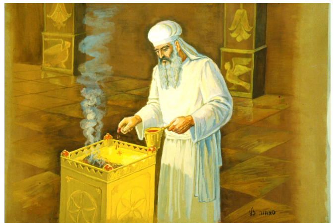
טבילת האצבע בהזאת דם החטאת. הכהן המזה בהיכל צריך לטבול את אצבעו בכל הזייה והזייה. נחלקו ראשונים האם דין זה נאמר גם בחטאת חיצונית.

אולם הרמב"ם (מעשה"ק ה,ט הנ"ל) כותב: "אין בכל הקרבנות קרבן שטעון הזיית הדם באצבע אלא החטאת בלבד, שנאמר בה 'וטבל אצבעו בדם'. וצריך שיהיה שם דם כדי טבילה, לא שיספג אצבעו בדם". הפסוק שהביא עוסק בחטאת פנימית, אבל הרמב"ם מסב זאת על החטאות בכלל, וכל דבריו בהלכות אלה (ז-י) עוסקים בחטאת חיצונית. וכבר תמה המלבי"ם (ויקרא סי' רכג) כעין זה, לגבי ההלכה שצריך לטבול אצבעו מחדש על כל קרן וקרן, מה מקורו של הרמב"ם להרחיב זאת גם לחטאת חיצונית? יש אומרים, שלדעת הרמב"ם כל החטאות הוקשו לחטאת פנימית לעניין זה (מרומי שדה לעיל מ,א 14 ; רש"ש בפרה ג,ט, וראה על כך גם במערכה הבאה).