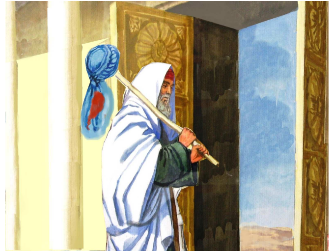
בגד ובו דם שיצא מחוץ לקלעים. המשנה אומרת שבגד זה טעון כיבוס, למרות שהדם נפסל ביציאה. מן הרמב"ם משתמע שחטאת שנפסלה, אפילו אחרי זריקתה, נפטרת למפרע מן הכיבוס. לדעתו צריך לומר שדם שנפסל למפרע אכן חייב בכיבוס, ורק פסול כללי בחטאת פוטר מן הכיבוס למפרע.

ושיצאה. איזו היא שלא היה לה שעת היתר לכהנים? שנשחטה חוץ לזמנה חוץ למקומה ושקבלו פסולין וזרקו את דמה! 13 הדוגמאות ל"היה לה" ו"לא היה לה" זהות למשנתנו, אלא ששם עסקינן ב"שעת היתר לכהנים", ופשוטו של דבר – שעת היתר לאכילה. מכל מקום, הגמ' שם (ד,ב והלאה) מתלבטת האם מדובר ב'היתר זריקה', ולפי זה 'לנה' היינו לינת הדם, או ב'היתר אכילה', ומדובר על לינת הבשר, ומביאה מחלוקת אמוראים בדבר. הכרעת הרמב"ם (הל' מעילה ג,א) שמדובר בהיתר אכילה, על פי פשטי המשניות (עיין בנושאי כליו).