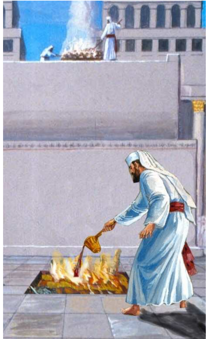
שריפת דם שנטמא. דם שנטמא ישרף בעזרה, כפסולי המוקדשין, בניגוד לדם שנפסל מסיבות אחרות, שנשפך לאמת המים שבעזרה. המפרשים התחבטו בסיבה להבדל זה.

באשר לדם שנטמא, שעל פי הברייתא ישרף ולא ישפך לאמה ככל דם פסול, אפשר שזה משום שהפסול בו קל יותר; או שכך עיקר דינו של דם פסול, והדין הרגיל של שפיכה לאמה אינו אלא מחמת הקושי המעשי לשורפו. הרמב"ם השמיט זאת, כשיטתו שדם הקדשים אינו מקבל טומאה כלל.