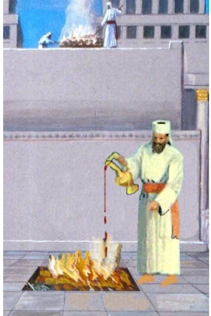
נסכים שנשטמו - שיטת רש"י. השריפה נעשית על רצפת העזרה, ככל פסולי המוקדשין.

הסוגיה כאן עוסקת בסוג מסוים של קרבנות: נסכים, דם, שמן ומנחות, מה דינם כשנטמאו: האם הם נשרפים, כיצד והיכן?