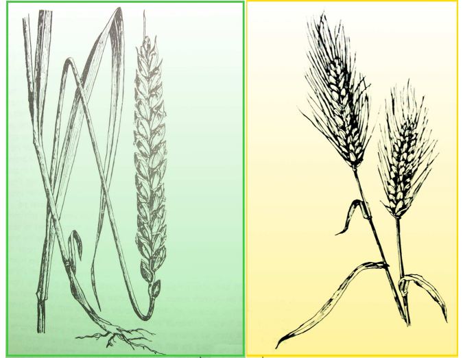
שעורים (מימין) וחטים (השעורה ניכרת במלענים - החודים - הארוכים). מנחת שוטה באה מן השעורים: "כשם שמעשיה מעשה בהמה - כך קרבנה מאכל בהמה" (סוטה פ"ב מ"א).

לומר שמנחת שוטה אף גרועה ממנחת נדבה. כך מצאנו ברש"י במנחות (הב ד"ה ובדבר הראוי לעבודה), שמגדיר את מנחת הסוטה: "דלאו עבודה היא, דלברר עוון קאתיא" 1 . ב. היתרון בסוג הקרבן, שבמנחת נדבה יש שמן ולבונה ובמנחת שוטה אין, איננו הבדל שגרתי בסוג הקרבנות. במנחת שוטה התורה קובעת לאו מיוחד על מתן שמן ולבונה, כדי שקרבנה לא יהיה מכובד (עיין סוטה יד, א וטו, א) 2 . אמנם גם במנחת חוטה יש לאו כזה, אבל כפרתה החשובה גוברת על ההפרש הגדול בסוג הקרבן, ואפשר שתפקידה של מנחת שוטה, החשוב פחות, לא יגבר על הפרש גדול שכזה בסוג הקרבן.