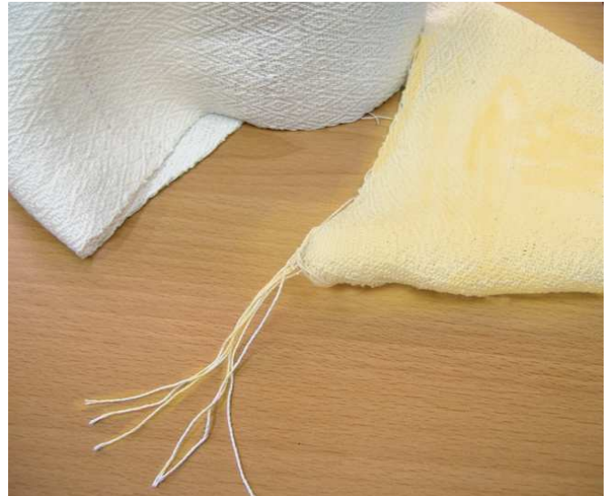
הפקעת פתילות מבגדי הכהונה. בברייתא נאמר שבגדי כהונה שבלו נוצלו לעשיית פתילות למנורה ולתאורה במקדש. משתמע ממנה שבדרך כלל הבגדים היו בשימוש חוזר זמן רב, עד לבלייתם, ומסתבר שגם נתכבסו מעת לעת.