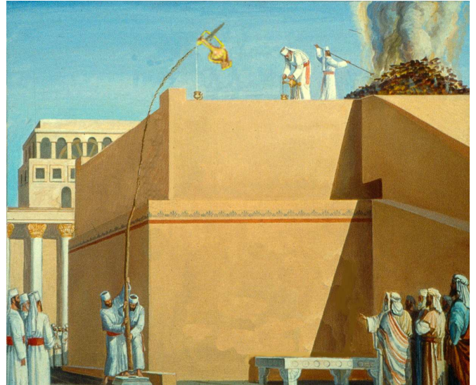
"תלנהו בקניא". העומד ברצפת העזרה ואחז בעזרת קנה כלשהו קרבן ותולה אותו באויר המזבח – על כך הספק האם נתקדש. הרמב"ם סתם שאויר המזבח כמזבח, ולא חילק בין אופנים שונים של החזקת הקרבן.

האמור בגמ' בשבת (ג,א) לעניין הוצאה מרשות לרשות, שעמידת האדם נחשבת כהנחת החפץ על הארץ, ואף כאן הקרבן נחשב כמונח על המזבח ולא באויר. אולם בקרן אורה ביאר את הסברה באופן אחר, שכהן שעומד ועבודה בידו הרי זוהי דרך העבודה, ולכן הקרבן נחשב כמצוי ברשות המזבח. לפי זה, גם כשעמד בקרקע העזרה ואחז את הקרבן כדרך עבודה מעל המזבח הרי זה מתקדש 12 . נראה שלפי דרכו רב אשי פושט את הספק באופן חלקי, שאויר המזבח כמזבח לעניין מה שראוי להיות באוירו ודרך עבודתו בכך, מה שאין כן כשתלוי בקנה.