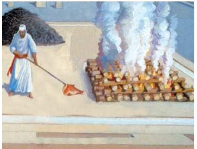
הורדה כלאחר יד - שיטת הראב"ד. רבי חנינא סגן הכהנים מעיד שאביו היה מוריד אברי בעל מום מן המזבח "כלאחר יד", והראב"ד מפרש שהיה עושה זאת בשינוי, ולא בידים.

במשנה מובאת אמירתו של ר' חנינא סגן הכהנים: "דוחה היה אבא את בעלי מומין מעל גבי המזבח". הגמ' (פה,ב) מציעה שתי אפשרויות להבנת דברי ר' חנינא: האחת, שדעתו כתנא קמא, ובא לחזק את דבריו ולומר שכך אכן נעשה בפועל במקדש. השנייה, ש"דוחה" פירושו "כלאחר יד". נראה, שיש מחלוקת בראשונים בפירוש מושג זה: רש"י (ד"ה כלאחר יד) כותב: "ואין מורידן דרך בזיון בפרהסיא", כלומר, שאמנם מותר וצריך להורידם, אבל יש לעשות זאת באופן שאינו ניכר ומעורר תשומת לב, משום בזיון הקדשים. לעומתו, הראב"ד (בפירושו לתורת כהנים, פרשת צו, פרשת א,ט) כותב: "ואיהו סבר דוחה כלאחר יד, אבל בידים לא". משמעות לשונו, שהנקודה איננה הפרהסיא ומניעת הבזיון, אלא שיש חשש איסור בהורדת בעל מום מן המזבח, ולכן יש לעשות זאת בשינוי 5 .