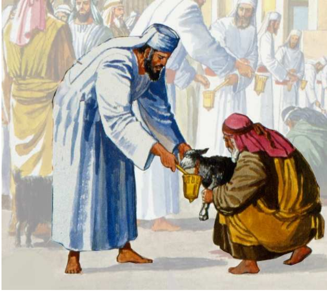
קרבת שדמו התקבל על ידי מחוסר בגדים (ללא אבנט). לדעת רבי יהודה ירד, כדין קרבן שדמו נשפך, ורק אם התקבל על ידי טמא – לא ירד, כי בקרבן ציבור מצינו שעבודת הטמאים כשרה. לדעת רבי שמעון כתב רש"י שלא ירד, אך תוספות מצדדים שאף רבי שמעון מודה שירד.

ונחלקו רק בדעת ר"ש, האם שחיטת דרום היא "כמאן דחנקינהו". הגמ' מסיימת שלא ירדו, ו"תיובתא דרבה תיובתא".