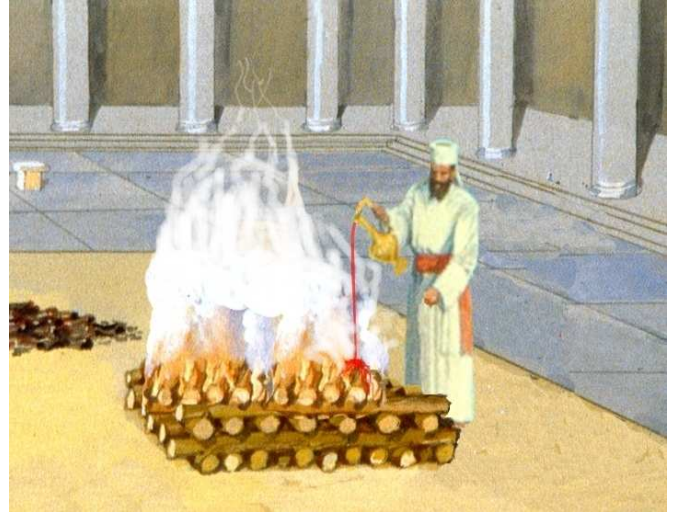
שפיכת דם על גבי האישים. על פי שיטת רבן גמליאל שדם שעלה לא ירד, אומרת הגמרא שיש לזרוקו כהלכתו. אולם התוספתא מחדשת, שלפי דעה זו צריך לשפכו על גבי האש.

דעת ר' יוסי הגלילי ור' עקיבא בעניין הדם אינה ברורה: בלחם משנה (הל' פסולי המוקדשין ג, ג) כתב שלדעתם אינו מתקדש, שכן "עולה" או "כבשים" הם דבר הנקטר. לעומתו, בזבח תודה (ד"ה והלכתא) כתב שלא מיעטו אלא דבר שאינו מין כבשים או עולה, אבל הדם הוא עיקרו של הכבש והעולה, וראוי שיתקדש לדעתם.