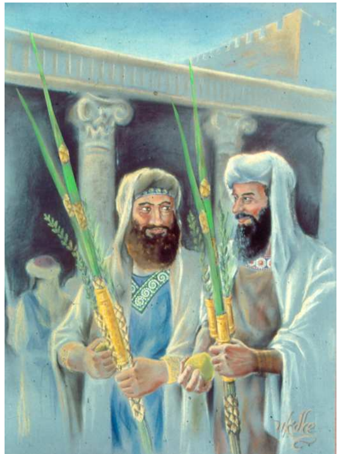
"בל תוסיף" בנטילת שני לולבים. במצוות שבהם התורה הגדירה כמות מסוימת – אסור להוסיף עליה. נחלקו הראשונים האם בנטילת שני לולבים יש איסור בל תוסיף: לדעת הרמב"ם (הל' לולב ז,ז) הדבר אסור, כמו בתוספת על מתנות הדם, ואילו הראב"ד שם והתוספות בראש השנה (כח,ב ד"ה ומנא תימרא) מתירים. לדעת תוספות, בתוספת מתנות דם יש בל תוסיף משום שהם ניתנות במקום אחר מהמתנה הראשונה, אבל מתנה נוספת באותו מקום עצמו, וכך גם נטילת שני לולבים כאחת, איננה "בל תוסיף".

את משפט הסיום, "ועוד אמר ר' יהושע", מסביר הריטב"א: "ולכשתמצא לומר דבתרוייהו ליכא למימר הכי אלא כשהוא בעצמו, וכי אין בזה אלא מפני מראית העין שנראה כמוסיף או גורע, מוטב לגרוע בשב ואל תעשה מלהוסיף שנראה כעובר בקום ועשה, כן נראה לי". פירוש: ר' יהושע מסופק בדבר, ודעתו נוטה שמסברה דווקא בבל תגרע יש מקום להקל בתערובת, אבל הוסיף שאפילו אם