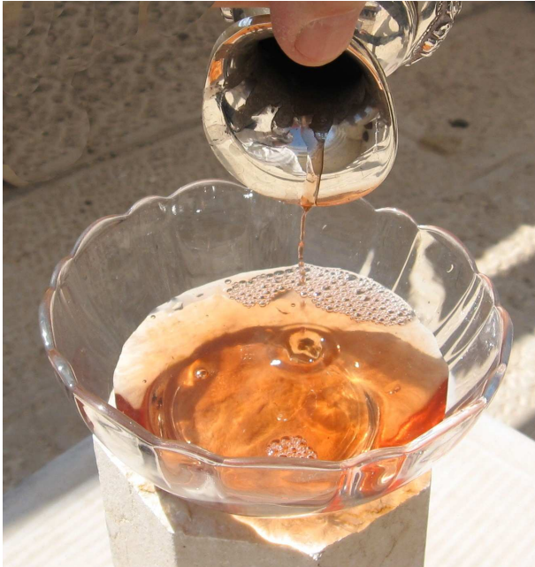
"יש בילה". על פי השיטה שיש בילה, נוזלים הנשפכים זה לזה מתמזגים במידה כזו, שבכל חלק מן הנוזל יש משהו משני מרכיביו.

התערובת יש להניח שיש בה בין מדם הפר ובין מדם השעיר, וזה כדעה שיש בילה (וכן פסק הרמב"ם הל' עבודת יום הכיפורים ה'י 15 ). ממילא מסתבר, שגם הראשונים שנוקטים כר' אליעזר בעניין "לשם מים" – יפסקו כחכמים שיש בילה.