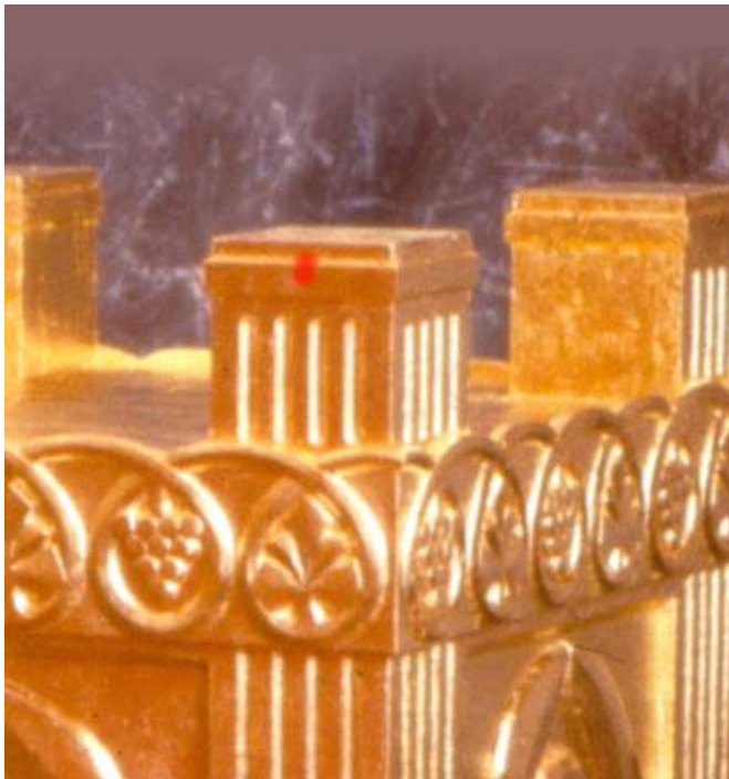
שיעור נתינה – שיטת תוספות. לדעתם די בכך שרושם הדם ניכר, אבל אולי כוונתם ששיעור זה נצרך לכל הדעות.

עניין זה נדון בשטמ"ק (פא,ב בהשמטות אות ג), וז"ל: "דשמא לא בעי שיעורא, דאפילו אם תמצא לומר דבעלמא בעי שיעורא – הכא במתן קרנות דפנימי לא בעי שיעורא, דלהזאות דלפני ולפנים ולפרוכת מסתמא לא בעי שיעורא, ד'וזהו' – כל שהוא משמע. ועוד יש לומר, דאפילו את"ל דבהזאות דפרוכת בעי שיעורא, מכל מקום גבי מתן קרנות, דכתיב 'דם הפר ודם השעיר', גזירת הכתוב הוא... דאפילו אין במתנה רק חצי שיעור מזה וחצי שיעור מזה, אפילו הכי קאמר רחמנא דמצותו בכך". דבריו צריכים ביאור, שפתח במתן הקרנות, שנאמרה בו נתינה, וסיים בהזאות שלפני ולפנים ועל הפרוכת, שבהם נאמרה הזאה! ונראה שכוונתו כך: בהזאות מסתבר שאין צורך בשיעור, משום שכך משמעות לשון 'וזהו', ואילו במתן הקרנות צריך שיעור, אבל אין צורך בשיעור לפר ושיעור לשעיר, כי די בשיעור אחד לשניהם, כיוון שמצוה לערבם 8 (והמשפט: "במתן קרנות... לא בעי שיעורא" נסמך על הסברה של גזירת הכתוב שבהמשך, והמשך המשפט "דלהזאות" וכו' אינו נימוק לדלעיל).