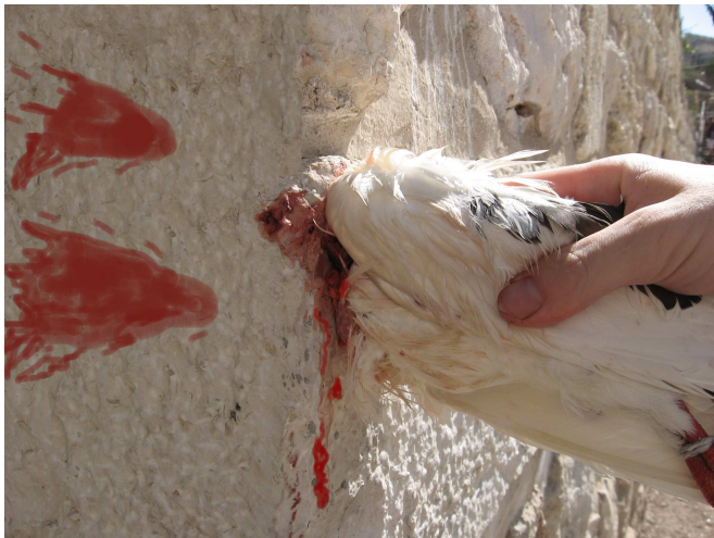
מיצוי בעולת העוף לאחר שכבר נעשתה הזאה (ראה את הדם המרוחק מהעוף). מסקנת תוספות, שאם היזה בעולת העוף לפני המיצוי - ההזאה לא פוסלת, למרות שנחסר חלק מן הדם, ולמרות שעשה את העולה כמו חטאת, הטעונה הזאה ומיצוי.

בגמ' נאמר ש"עולת העוף שעשאה למעלה כמעשה חטאת" פירושו ששינה במיצוי. תוס' (ד"ה ואלא במיצוי) מתחבטים בפירוש הדברים: אם הכוונה שהיזה ואחר כך מיצה - לא מובן מדוע העולה נפסלת בכך, שהרי הדין שימצה את כל הדם אינו מעכב, ולא מסתבר שדם מועט שנשפך יפסול את הקרבן (עיין מערכה קסא). בהמשך הציעו שאולי הזאה זו פוסלת, במובן שהקרבן כיפר אך נפסל מלאוכלו, על פי הדין: "שלא במקומו - כמקומו דמי" (לעיל כו,ב) 1 ; ודחו, שדין "שלא במקומו כמקומו" נאמר על שינוי במקום, ולא על שינוי בצורת העבודה. לבסוף תוס' מסיקים כפירוש רש"י (ד"ה אלא במיצוי, בסופו), שלא מיצה כלל