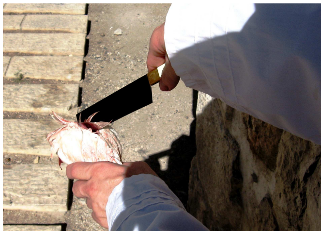
"קודרה בסכין כמין ארובה". לדעת תנא דבי רבי ישמעאל יש להוציא את הזפק ואת העור והנוצה שעליו על ידי נעיצת סכין, היוצר חור עמוק כמין ארובה. כך יוצא הזפק ועורו ללא עור נוסף שאינו שייך לו. הראב"ד מסביר שלפי הברייתא השניה אין צורך לדקדק בדבר וניתן ליטול את הזפק ועורו ביד, וכן פסק הרמב"ם.

נראה שכך פירש הרמב"ם, שכן פסק (הל' מעשה הקרבנות ו, כא): "ובא לו לגוף, והסיר את המוראה והעור שעליה בידו עם הנוצה". לא הזכיר את הסכין, ונראה שלדעתו תנא קמא חולק בנקודה זו (עיין בהרחבה ב'שם עולם' על התורה שם). כך היא גם שיטת תוס' בחולין (קכא, א ד"ה מרטקא), שכתבו שאין צורך בסכין בקרבן העוף. 7