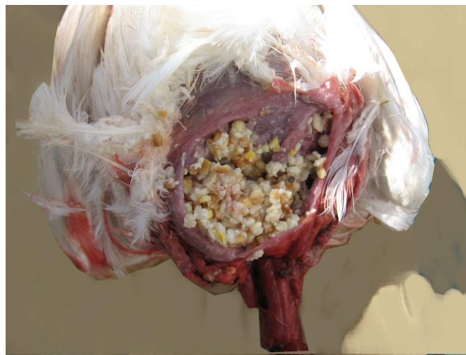
הנוצה שעל עור הזפק. במשנה נאמר שיש להוציא את הזפק עם הנוצה הסמוכה לו, שכן זוהי "נוצתה" האמורה בתורה. כך נפסק להלכה, אך נחלקו ראשונים האם דין זה מוסכם בין התנאים או שנוי במחלוקת. בתמונה נראית הזפק פתוחה ובה מאכלו של העוף, וסביבו הנוצה.

מדברי הראב"ד (בפירושו לתורת כהנים שם) עולה שפירש את המחלוקת כהבנת הרמב"ן: "אבא יוסי אומר נוטל את הקורקבנים עימה – פירוש: שאף הוא מקום מוראה, שהרי האוכל מתקבץ שם והוא טוחן". כלומר: לפי אבא יוסי, יש ליטול את הקורקבן לא משום שהוא ה"נוצה" האמורה בתורה, אלא משום שהוא כלול ב"מוראה", וכפי שפירש הרמב"ן.