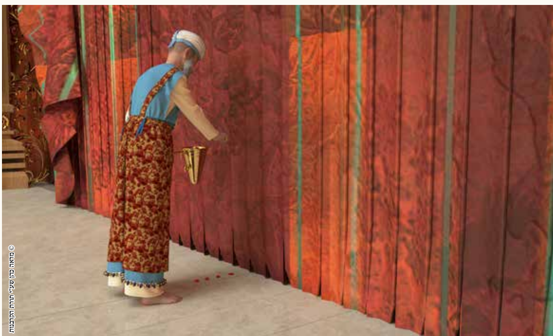
© מהארז כהן שיעור תורה התקבנות

בפר כהן משיח ופר העלם דבר של ציבור נותנים י"א הזאות מהדם - שבע הזאות על הפרוכת וארבע על קרנות מזבח הזהב, וכל המתנות מעכבות.