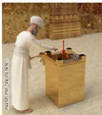
הזאה על טהרו של מזבח

[למ"ד שאין מערבין את דם הפר והשעיר לפני ארבע המתנות שעל קרנות המזבח, יש עוד ד' הזאות על הקרנות, סה"כ מ"ז הזאות].