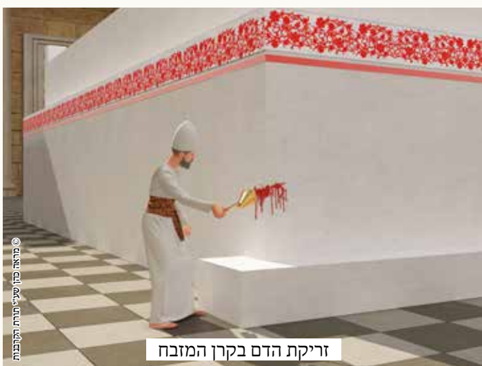
זריקת הדם בקרן המזבח