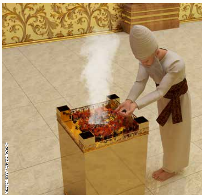
© מראה כהן שטיי תורתו הקרבנות