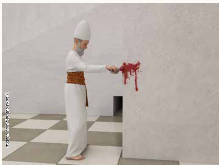
בחטאת העוף הזאת הדם מתיר את אכילת הבשר לכהנים.

מד. 'עולת העוף דמה מתיר את בשרה למזבח, חטאת העוף דמה מתיר את בשרה לכהנים'.