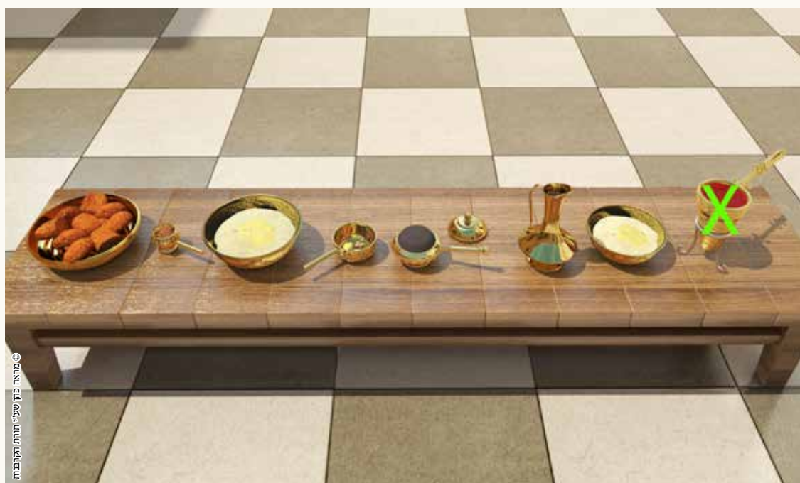
© מראה כהן שיעי תורתו התקבנות

מה: 'דברים שאין חייבים עליהם משום פיגול, חייבין עליהן משום נותר ומשום טמא, חוץ מן הדם'.