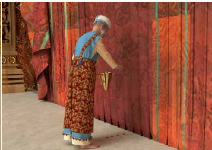
שבע הזאות על הפרוכת