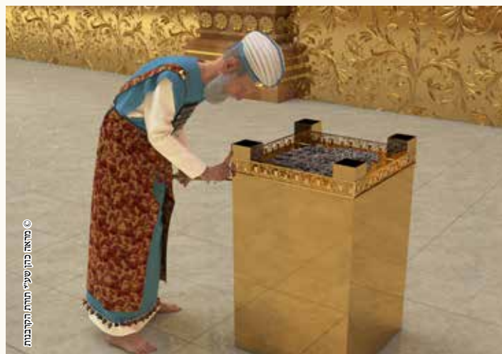
ארבע מתנות על ארבע קרנות

בפר חטאת של כהן משיח שחטא, ופר חטאת של ציבור שחטאו - מזים שבע הזאות בהיכל על הפרוכת, וארבע מתנות על קרנות מזבח הזהב.