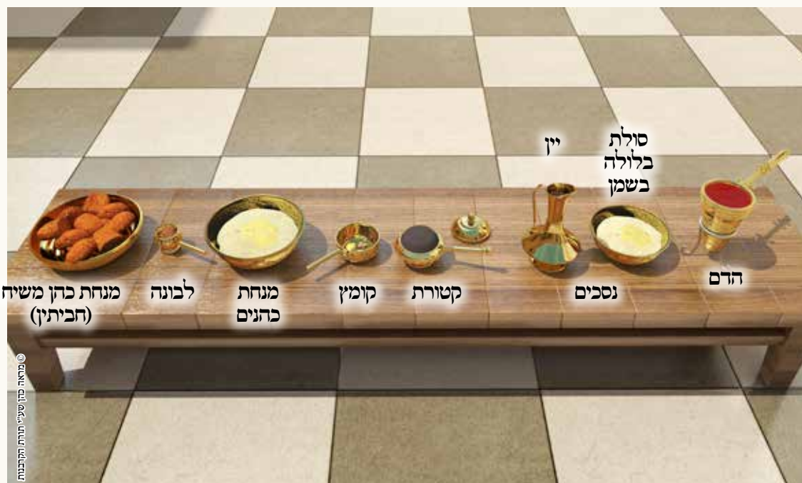
מראה כהן שיעי תורתו התקיימת

קרבן שחשבו בו מחשבת פיגול (-לאכול או להקטיר מחוץ לזמן), האוכל מהבשר או משיירי המנחה חייב כרת, כיון שהם ניתרים על ידי הקרבן. אבל אם אוכל מדבר שאינו נותר אלא הוא מתיר אחרים - אינו חייב כרת, ולכן אין כרת באוכל מהדברים הנ"ל.