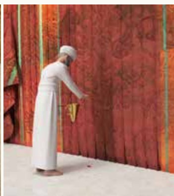
הזאות כנגד הפרוכת