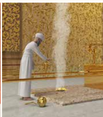
הזאות בין הבדים