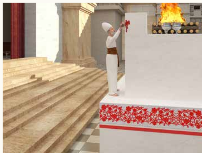
בעולת העוף מיצוי הדם מתיר את הקטרת הבשר למזבח,