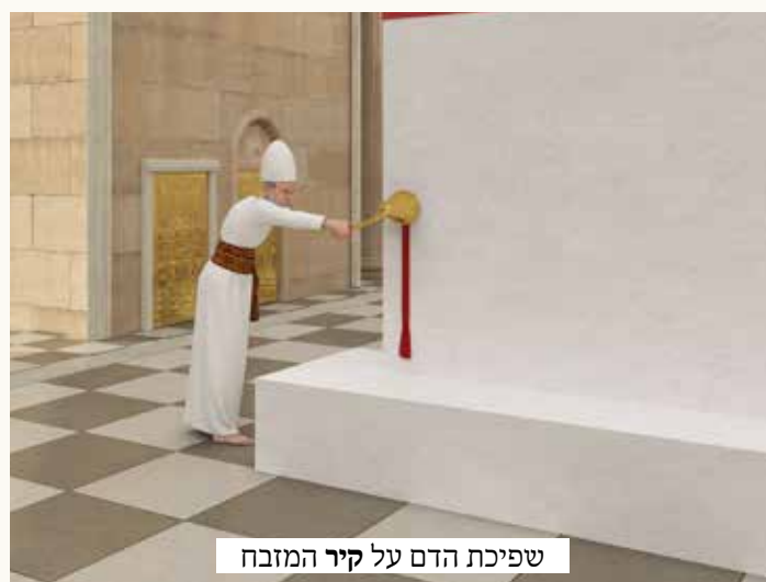
שפיכת הדם על קיר המזבח