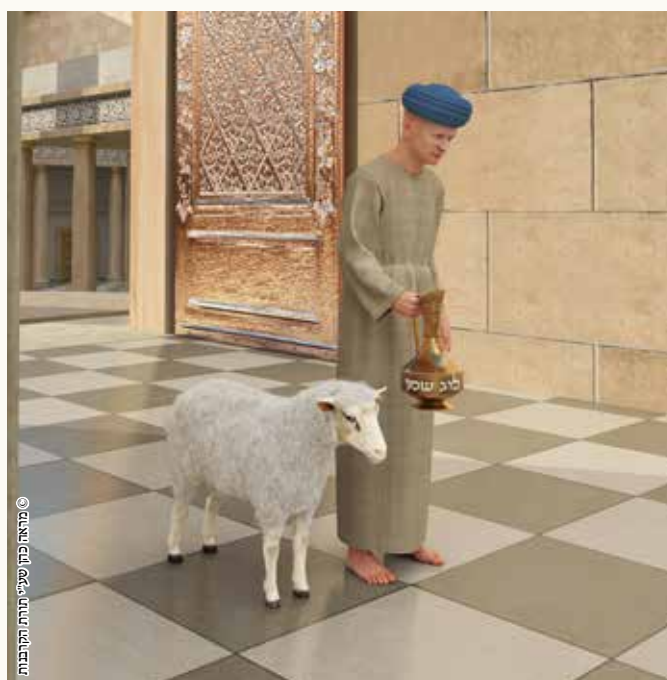
מראה כהן שיעי תורתו התקיימת

אם פיגל באשם מצורע, מחלוקת רבי שמעון ורבי מאיר האם הלוג שמן מתפגל עמו והאוכל משיירי הלוג חייב כרת.