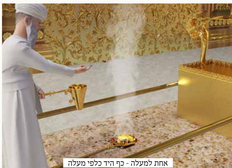
אחת למעלה - כף היד כלפי מעלה