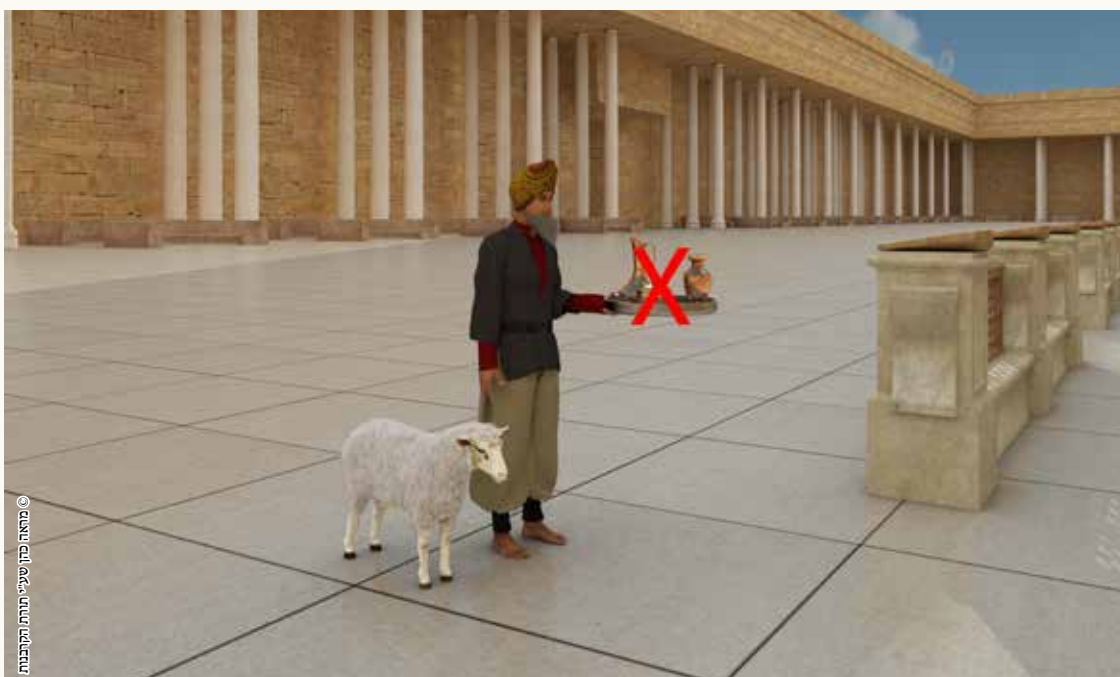
© מראה כהן שיעי תורתו התקבנות

גוי יכול להביא קרבן לבית המקדש אבל יש לקרבן דינים מיוחדים [אין חיוב מעילה, אין חיוב כרת מי שאוכל מהבשר של פיגול נותר וטמא, ועוד], ואינו מביא נסכים עם הקרבן. [יש אומרים שאם הביא נסכים מקבלים ממנו].