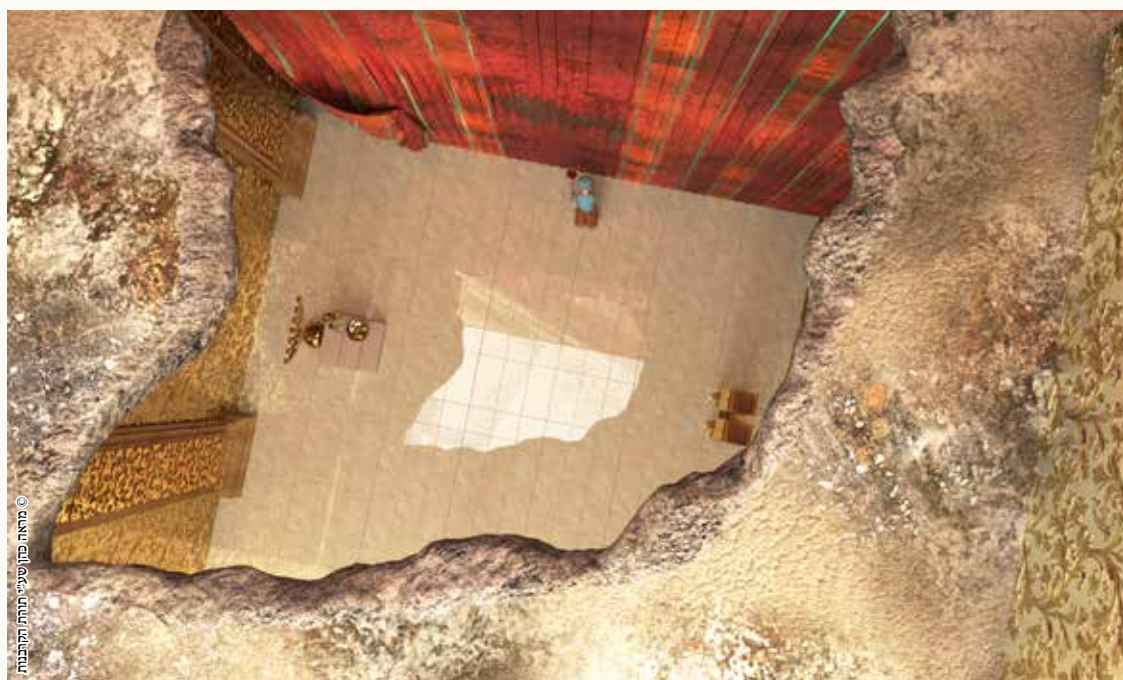
© מראה כהן שטיי תורתו הקרבנות

אם נשבר מהתקרה של ההיכל, אי אפשר לתת את המתנות שעל הפרוכת ועל מזבח הזהב.