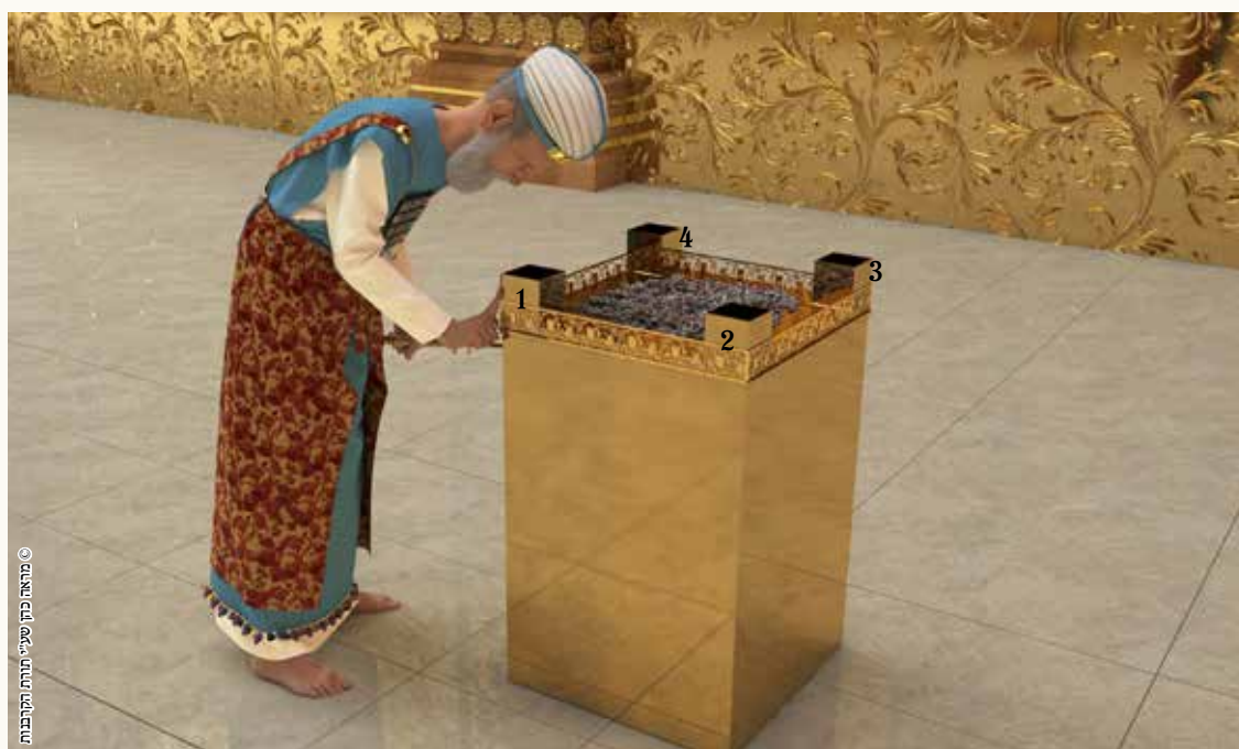
© מהארז כהן שיעור תורה התקבנות

לט. 'מתן ארבע מניין'. לט. הכהן הגדול עומד לפני מזבח הזהב לצורך נתינת ארבע מתנות הדם על קרנות המזבח הפנימי.