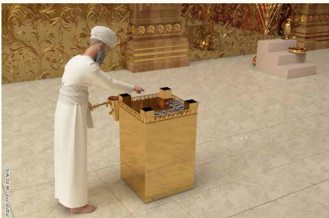
מראה כהן שעיר יתרו הקרבנות

ביום כיפור הכהן גדול מזה מדם הפר והשעיר (כשהם מעורבים יחד) שבע הזאות עלג המזבח, במקום שאין בו דשן. [מפנים את הגחלים והקטורת לצד ובמקום המטוהר מגחלים מזים].