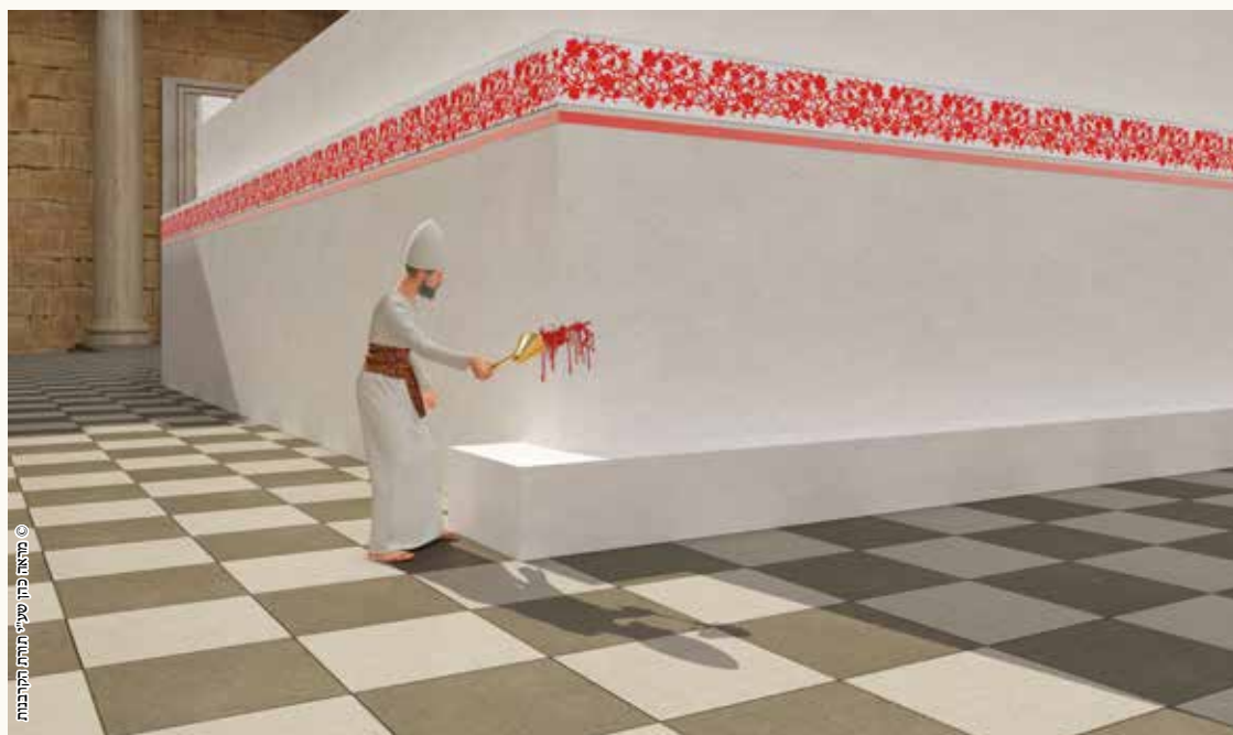
זריקת דם עולה [בתמונה נראית זריקה בקרן מזרחית צפונית]

הזריקה של דם קרבן עולה במזבח מתיר להקטיר את הבשר במזבח, ולחלק את העור לכהנים.