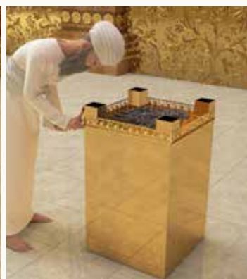
נתינה בקרנות המזבח