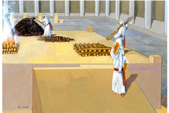
האויר בין הכבש למזבח – שיטת היעב"ץ. לדעתו הרווח היה צר בחצי המזרחי של הכבש ורחב בחציו המערבי, על פי הגרסה בגמרא שיש שם "לול" לירידת הכהנים.

כמה מהאחרונים דחו את שיטת רבנו חיים, מכח הקשיים