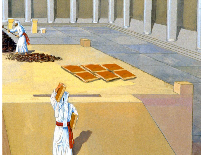
מערכה מעצים אמה על אמה. שיטת הרמב"ם שכל המערכה נעשית מעצים בגודל אמה על אמה.

אלא מעצם העניין: אין סיבה לעשות עצים בגודל כל המערכה, פרט לשני גזירים אלו, כדי לייחדם משאר עצי המערכה. כך ניתן להבין גם מן הירושלמי הנ"ל: הירושלמי דן במי שנודב עצים באמרו "הרי עלי עץ", כמה עצים עליו להביא, ואומר שדיו בגזיר אחד, שכן מצינו שעץ אחד נחשב כקרבן בפני עצמו, "כהיא דתנינן תמן: שנים בידם שני גזירי עצים... רבי יהושע בן לוי אמר: עוביין באמה...". משתמע שדברי ריב"ל מוסבים על שני גזירי העצים שניתנים עם התמיד; אלא שיש מקום לפרשו על יחיד הנודב עצים דווקא 10 .