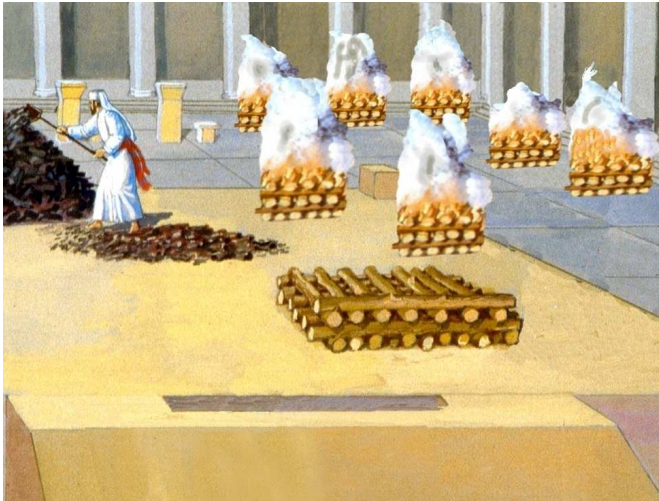
הקטרה על רצפת העזרה. לדעת רבי יהודה, שלמה המלך קידש את כל רצפת העזרה להקטרה. גם לדעתו, רק המזבח עצמו ראוי למתן דמים.

גם מבחינה מעשית, אין צורך בהרחבת המקום הראוי לזריקת דם, שכן הדם הנורק על המזבח נשפך משם מיד אל אמת המים שבעזרה, בניגוד לחלבים, השוהים על המזבח עד תום שריפתם.