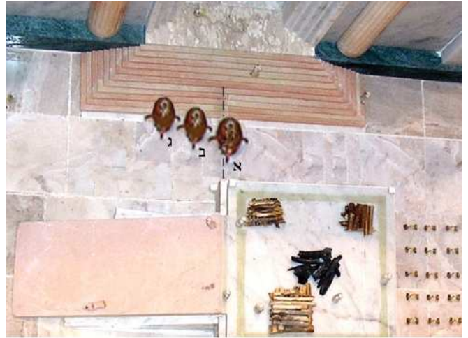
מקום הכיור על פי השיטה שהמזבח בצפון. א – שיטת הראב"ד: הכיור בקו האמצע של העזרה, רובו בצפון ומיעוטו בדרום. ב-שיטת רש"י: כל הכיור מדרום למזבח ולא כנגדו. ג – שיטת המלבי"ם: הכיור מדרום לפתח ההיכל.

שהכיור לא יחצוץ בין הפתח למזבח, אלא שלא יעמוד כלל כנגד הפתח. ממילא, לדעת ריה"ג שכל המזבח בצפון, הכיור מרוחק ממנו לפחות חמש אמות דרומה. כדעה זו כותב גם בעולת שלמה כאן, ודייק מלשון ריה"ג "בין האולם ולמזבח", שהכיור אינו כנגד פתח ההיכל, אלא כנגד האולם.