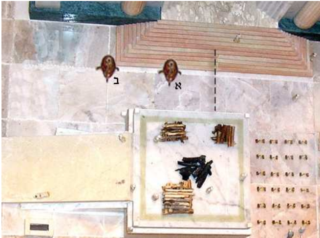
מקום הכיור על פי השיטה שהמזבח בדרום. א - שיטת תוספות וסיעתם: הכיור בין המזבח להיכל, מדרום לפתחו. ב - שיטת הלחם משנה וציוור הרמב"ם: הכיור מדרום למזבח.

ולעמוד סביבו ולקדש (מעשי למלך, הל' בית הבחירה א,ו). על פי הטעם הראשון, יש להעמיד את הכיור דווקא מדרום למזבח; אך לפי הטעם השני, נראה שאין מניעה להעמיד את הכיור כנגד המזבח, כדי לצאת ידי כל הדעות.