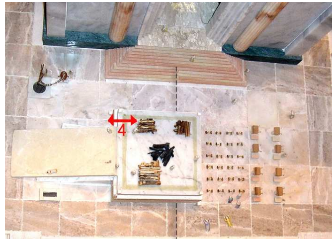
מקום המערכה השניה – שיטת הרמב"ם. רוב המזבח בדרום, והמערכה במרחק ארבע אמות מן היסוד, במקום הקרוב ביותר לכבש, למרות שאיננו כנגד פתח היכל והאולם.

כפירוש רש"י הנ"ל, ופסק הרמב"ם כמותם 6 . כמה מפרשים מסבירים כעין זה אף בדעת ר' יוסי: הגמ' ביומא הנ"ל, שפשטה מורה שניתן לקחת גחלים מכל הצד המערבי, אף שלא כנגד הפתח, סוברת שר' יוסי הכשיר את כל הצד המערבי לעניין זה, ולא כסוגיה כאן. הרמב"ם פסק להלכה כסוגיה שם, משום שהיא מסתייעת מן התורת כהנים (אחרי מות פרק ג, ו-ז), שם נאמר: "מעל המזבח, יכול כולו? תלמוד לומר 'אשר לפני ה'", הא כיצד? הסמוך למערב ... אמר רבי יוסי זה סימן...". משמע, שדי בכך שתהיה סמוכה למערב (הר המוריה, הל' תו"מ שם) 7 . כמו כן, המשנה בזבחים (מז, א) וביומא (נח, ב), האומרת ששיירי דם החטאות הפנימיות ניתנים "על יסוד מערבי", ללא ציון המקום שכנגד הפתח דווקא, מוכיחה שאין חובה לתת במקום המדויק הסמוך ביותר להיכל, אלא בצד המזבח הסמוך להיכל (זבח תודה, ריש פרק חמישי; זבחי אפרים כאן) 8 .