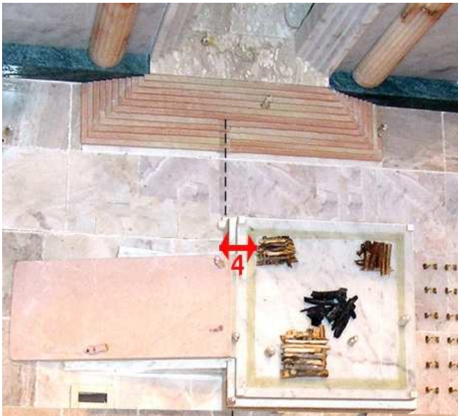
מקום המערכה השניה – שיטת רבי זירא ורבי שרביא. המערכה רחוקה ד' אמות מן היסוד, והיא מול פתח ההיכל. זהו המקום הצפוני ביותר בו ניתן למקם אותה, מאחר שהמזבח עומד בצפון העזרה.

נמצא בצפון העזרה, ו"ארבע אמות מן הקרן" היינו, ארבע אמות מן הקרן שבתחתית המזבח, כלומר, קצהו התחתון: היסוד, הסובב, הקרן, והאמה המיועדת להליכת הכהנים. באופן זה, המערכה נמצאת מול האמה הצפונית ביותר בפתח ההיכל (שחמש אמות ממנו בצפון וחמש בדרום), ואין להרחיק את המערכה צפונה יותר, כי אז לא תהיה מול הפתח (וכך פירשו המפרש בתמיד כט, א והרא"ש שם).