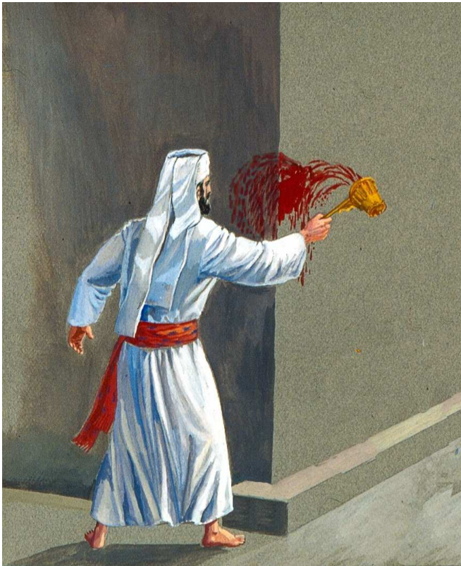
שיטת שמואל: מתנה אחת כמין גמא. מתנה אחת כנגד זוית המזבח, והדם ניכר בשני צדדיה.

בסוגיה כאן קיימת מחלוקת תנאים ואמוראים בדבר: דעת רב, שהכהן "נותן, וחוזר ונותן", כלומר, הכהן העומד בקרן צפונית-מזרחית זורק תחילה מן הדם על צד אחד של המזבח, כגון הקיר המזרחי, ולאחר מכן על הצד השני, הצפוני 2 . כך עושה הכהן גם בעמדו בקרן הדרומית מערבית. שמואל, לעומת זאת, סובר, שהכהן נותן "מתנה אחת כמין גמא" (אות יוונית, הדומה לאות ריש בעברית), כלומר, הכהן העומד בקרן צפונית-מזרחית זורק זריקה אחת על זית המזבח, באופן שהדם ניתן בבת אחת על הקיר הצפוני והקיר המזרחי של המזבח. כך עושה הכהן גם בעמדו בקרן הדרומית מערבית.