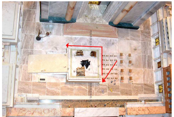
מסלול ההליכה במתן דם העולה. על פי המשנה בתמיד, הכהן השוחט בטבעות שמצפון למזבח פונה תחילה שמאלה לקרן הצפונית מזרחית של המזבח, נותן מן הדם על הקרן וממשיך משם ב"דרך ימין" לקרן הדרום מערבית, שם יתן מתנה נוספת וגם ישפוך את השיריים.

כאמור, הכהן נותן תחילה על הקרן הצפונית-מזרחית ולאחריה על הקרן הדרומית-מערבית. הטעם לסדר זה מבואר בגמ' ביומא (טו,ב), שהוא משום: "כל פינות שאתה פונה – לא יהו אלא דרך ימין". הדבר מעורר שאלה: מדוע הקרן הצפון-מזרחית היא הראשונה מצד ימין? הרי שחיטת העולה נעשית מצפון למזבח, והכהן ההולך משם ומקיף את המזבח לימינו מגיע לפני כן לקרן הדרום מערבית!?