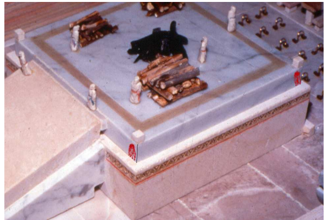
מתן דם "סביב" בחטאת. מכיוון שנאמר בחטאת שדמה ינתן "על קרנות המזבח סביב", יש להקפיד, אפילו אם הנתינה איננה ממש על חודו של קרן, שהדם ינתן על ארבעת צדי המזבח. לכן, אם הנתינה בקרן דרומית מזרחית היתה לכיוון דרום בלבד – יש לוודא שבקרן הצפון מזרחית תהיה נתינה במזרח.

בכמה סוגיות במסכת (יב; צב, ב; צד, ב) נאמר שבחטאת יש חומרות מיוחדות, כגון שדמה צריך להנתן "בקרן ובאצבע ובחודה". תוס' (צב, ב ד"ה וקרן; וכן בשטמ"ק יב, אות ט בשם תוס') מעירים, שצירוף זה של חומרות אינו מתיישב לפי שיטה מסוימת אחת, שהרי לדעת רבי צריך חודה, ואילו לדעת ראב"ש צריך קרן. על פי האמור יש ליישב, שהדברים אמורים לכל הדעות, אם ננקוט שגם לדעת רבי יש עדיפות לקרן גופה, ושלכל הדעות גם בקרן גופה יש עדיפות לחודה (וכן משמע ברש"י יב ד"ה וליטעמיק, עיין ליקוטי הלכות כאן, ונמוקי חיים להלן צב, ב). בתוספתא (זבחים וד) נאמר: "נתן על הקרן מכאן ומכאן – כשר, מן הקרן ולפנים – פסול", כלומר, שצדדיה הפנימיים של הקרן עצמה פסולים (חסדי דוד).