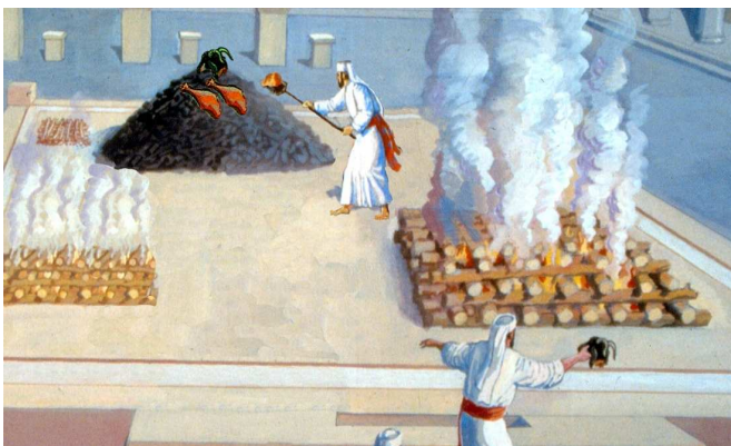
הקטרה על גחלים ללא אש (על ה'תפוח' במרכז הציור). לדעת הרמב"ן התנאי "לשם אישים" בא לשלול הקטרה באופן זה.

בספרי (קורח פסקא קטז) מצינו דעה שיש מצוה לכתחילה בהקטרה לשמה, ואפילו לשם הבעלים (ולא כתוס', ששם זבח לא שייך בהקטרה): "ר' יאשיה אומר: מניין אתה אומר שאם זרק את הדם ואינו יודע לשם מי זרקו, והקטיר את החלב ואינו יודע לשם מי הקטירו, שהכהנים נושאים עוון על כך? ת"ל 'אתה ובניך ובית אביך אתך תשאו את עוון המקדש'" (ועיין 'תורה שלמה' מילואים לפרשת בא, ח). מבחינה מעשית יש בכך קושי, שכן ההקטרה יכולה להיות בלילה, זמן רב אחרי השחיטה, וקשה להניח שהכהנים יוכלו לדעת של מי היה כל קרבן.