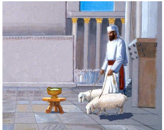
העברת נסכים מקרבן לקרבן. בסוגיה כאן נראה שלדעת חכמים מותר להעביר נסכים מקרבן אחד למשנהו, ואילו בסוגיה במנחות נאמר בפשטות שהדבר אסור.

באשר ללוג השמן של מצורע פסק הרמב"ם (הל' מחוסרי כפרה ה,ד): "יש לאדם להביא אשמו היום ולוגו אחר עשרה ימים, ואם רצה לשנות הלוג לאשם מצורע אחר" – משנה, אף על פי שקדש בכלי, וזה לכאורה כ' מאיר. אבל על פי דבריו בענין הנסכים יש לפרש, שהתיר לשנות את הלוג שקדש רק לפני שחיטת האשם, ולא לאחר מכן 7 . על כל פנים קשה, כיצד יתישב הפסק כחכמים עם הפסק שהשחיטה קובעת את הנסכים לזבח זה דווקא?