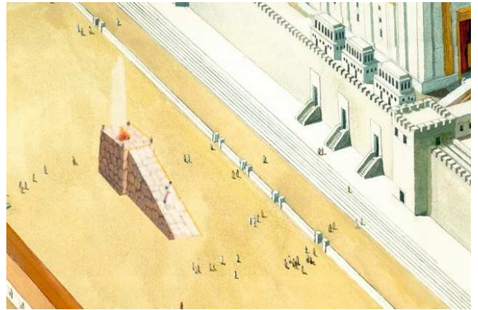
הקטרה בהר הבית (המזבח מחוץ לחיל ולעזרות). למרות שהקטרה מחוץ לעזרה נחשבת כ"העלאה בחוץ" האסורה, סובר רבי יום טוב שמי שמקריב קדשים קלים על מנת להקטירם בהר הבית או בירושלים אינו פוסל את הקרבן, ואין זו מחשבת "חוץ למקומו", מפני שמקום זה ראוי לאכילת הקרבן. לדעתו מחשבת "חוץ למקומו" נאמרה רק על מקום שאינו ראוי לא להקרבה ולא לאכילה.

אין בתוס' התייחסות לשאלה כיצד עונה ר' יו"ט על קושיית תוס' על רש"י, שמן הדרשה משתמע שדין "מקום משולש" עוסק גם במחשבת חוץ לזמנו, וראה על כך להלן.