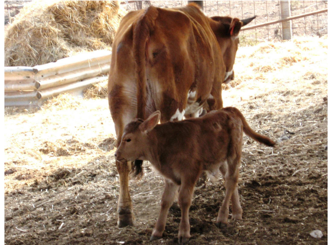
עור הראש של עגל הך. בעגל צעיר (תוך שנתו הראשונה, או כל עוד הוא יונק) עור הראש רך, ולכן לדעת רבי שמעון הוא ראוי לאכילה, והמחשבה עליו מפגלת. להלכה נפסק שלא כדעה זו.

לפי דרך זו אין לנו ראייה להוציא מהלכתא את כל מה שהוסיפו ר' יעקב ור' שמעון, גם אם תנא קמא בברייתא חולק בפרטים אלו 16 , אלא רק את הפרטים שעליהם אמר ר' יוחנן במפורש שלגרסתו נשנו בלשון יחיד: בית הפרסות (בחולין נה, ב) ועור הראש (שם קכב, ב). על עור בית הבושת לא מצאנו שר' יוחנן אומר זאת, ולכן דינו כבשר (חק נתן); לחם משנה הל' מאכלות אסורות ד, כא).