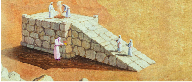
זריקת דם בבמה. לדעת רש"י "מקום המשולש" הוא השטח שמחוץ לעזרה, והוא נקרא כך מפני שבשעת היתר הבמות הוא כשר להקרבה ולאכילה, בניגוד להיכל.

עוד יש להבין בשיטת רש"י, מה טעמו של תנאי זה של "מקום משולש" הכשר לדם בשר ואימורין, ומדוע דווקא המקום המוכשר יותר להקרבה הוא זה שהמחשבה עליו פוסלת (שפת אמת)? אפשר שטעם הדבר מעין הסברה (זבחים ג,א): "דלאו מינה לא מחריב בה": החושב להקריב במקום שיש בו צד היתר – הרי זו מחשבה שעלולה להגיע לכלל מעשה, ולכן הקפידה עליה התורה, אבל החושב להקריב במקום שאין בו צד היתר כלל – מחשבתו בטלה.