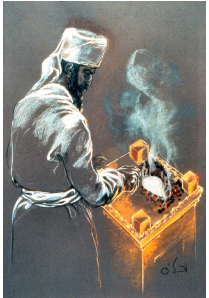
הקטרת קומץ המנחה על המזבח הפנימי. מזבח הזהב מיועד להקטרת קטורת ולמתן דם בחטאות הפנימיות בלבד, ואין להקטיר עליו דבר אחר. למרות זאת, גם קרבן פסול שאינו ראוי לו כלל, כגון קומץ המנחה, אם ניתן עליו - התקדש.

הגמ' מביאה את דברי ר' אלעזר, שהמזבח הפנימי מקדש פסולין. הגמ' אינה מביאה מקור בתורה לכך, ואדרבה, מקשה מזה החידוש בדבריו, הרי הם משתמעים מן הברייתא האומרת שהנותן דם עולה, למשל, במזבח הפנימי, ואחר כך מעלה את אבריה למזבח החיצון – לא ירדו ממנו. רש"י מבהיר, שראיית הגמ' היא משיטת ר' יהודה (פד, א), הסובר