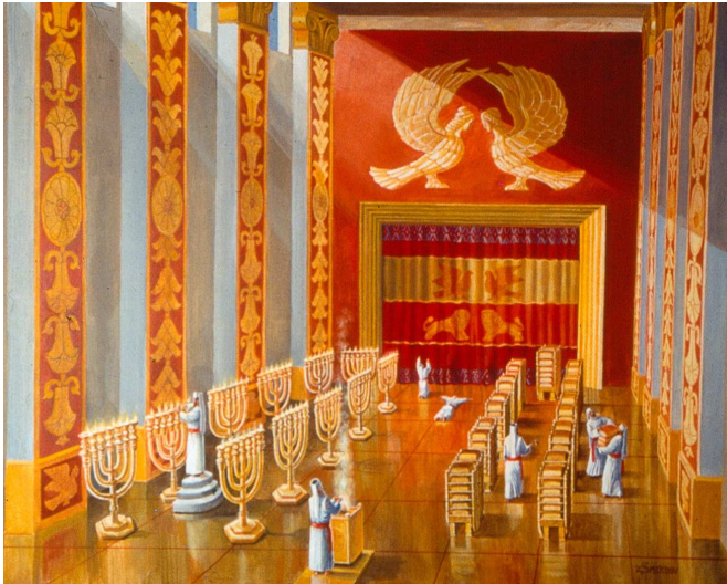
מזבח הזהב בבית המקדש הראשון. שלמה המלך עשה מזבח חדש במקום זה של בצלאל (ראה הערה 11). מזבח זה לא נמשח בשמן המשחה, אלא התחנך בעבודתו.