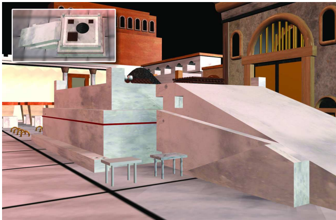
המזבח וחוט הסיקרא באמצעו. החלק שמחוט הסיקרא ומעלה משמש למתן דמים לחטאת בהמה ועולת העוף, ואילו החלק שמחוט הסיקרא ומטה הוא מקום מתן הדם בשאר הקרבנות. הנותן דם הראוי למטה בחלק העליון, או להיפך - זהו "שלא במקומו". לדעת שמואל, בכל זאת הקרבן מכפר על בעליו, והוא "פסול" במובן זה שבשרו אינו נאכל.

מהותי בין המקרים, אלא שמשנתנו עוסקת במקרה שלא נשאר מדם הנפש, ולפיכך הקרבן פסול 6 . אולם שמואל אינו יכול לפרש כך, שכן לשיטתו זריקת הדם שלא במקומו הכשירה את הקרבן, ורק בשרו נפסל, ואין מקום לזריקה נוספת מדם הנפש על מנת להכשיר את הבשר באכילה, שכן כלל הוא: רק זריקת דם המכפרת ראויה להתיר את הבשר באכילה. נמצא שהקולא של שמואל בכך שהקרבן כיפר מולידה חומרא, שאי אפשר לתקן את הזריקה שהיתה שלא במקומה. לפיכך מפרשת הגמ' שלדעתו המשנה בפרק שלישי עוסקת במקרה שחוץ משינוי המקום היה פסול נוסף, שהזורק את הדם היה פסול לעבודה, ולפיכך הקרבן לא התכפר כלל, וניתן לשוב ולזרוק 7 . על דעת ריש לקיש בעניין זה עיין בהערה 8 .